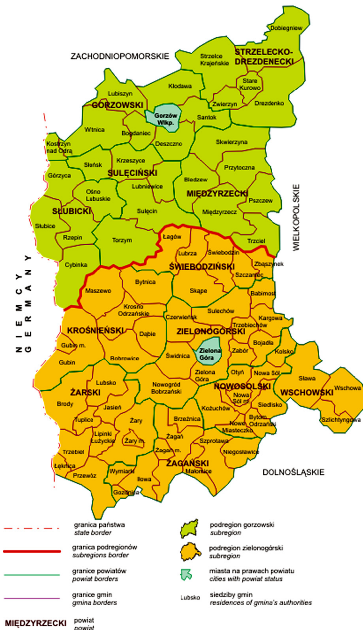
Ryc. 1. Podział administracyjny województwa lubuskiego