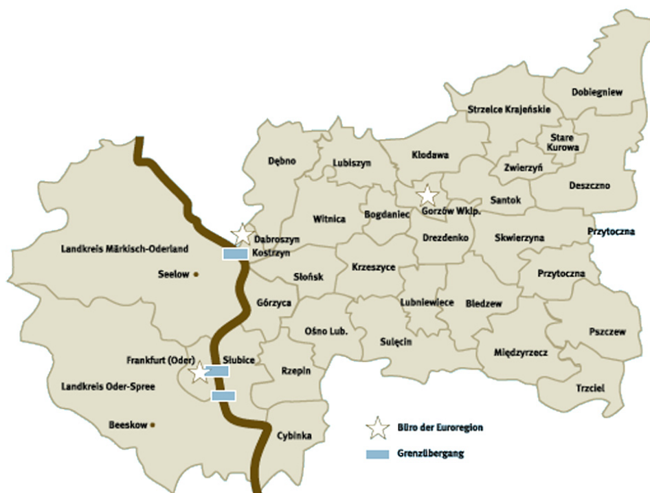
Ryc. 5. Mapa Euroregionu Pro Europa Viadrina