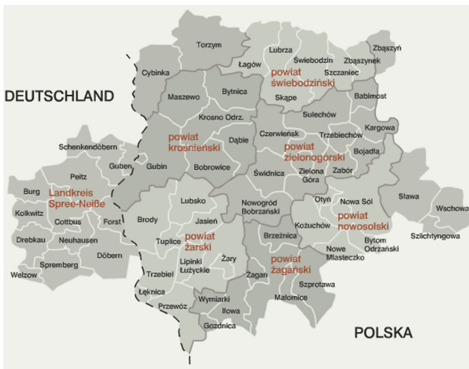
Ryc. 4. Mapa Euroregionu Sprewa-Nysa-Bóbr Źródło: http://www.euroregion-snb.pl [data dostępu: 7.07.2012].

W polskiej części euroregionu kompetencje do realizacji wsparcia z programu INTERREG IIIa skupione były w Urzędzie Marszałkowskim w Zielonej Górze. Zatwierdzenie projektów nastąpiło dopiero w marcu 2005 roku. Do połowy stycznia 2006 roku w polskiej części euroregionu zatwierdzono 30 projektów na łączną sumę wynoszącą około 16,31 mln euro. Budowa i modernizacja dróg, rozbudowa dalszej infrastruktury drogowej (priorytet 2.1) oraz budowa i modernizacja oczyszczalni ścieków, systemów odprowadzających ścieki i urządzeń utylizujących śmieci (priorytet 3.1) stanowią główne punkty ciężkości projektów w polskiej części euroregionu. Ponadto przyznane środki koncentrują się na budowie lub modernizacji infrastruktury komunalnych (priorytet 2.2). Priorytet 1 (współpraca gospodarcza i wsparcie małych i średnich przedsiębiorstw) cieszył się najmniejszym zainteresowaniem 14 .