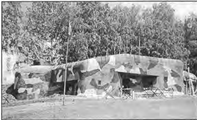
Tak wygląda jeden z obiektów w okolicach Nachodu. Nie jest wyjątkiem, szkoda, że na tym zdjęciu nie widać wyposażenia w środku

tam gdzie powinny. Dlaczego u nas w Polsce, w naszym Międzyrzeczku nie można zrobić tak jakby zrobiono w Czechach? Znam wielu młodych ludzi (sam jestem przedstawicielem), którzy chętnie chcieliby zaangażować się w takie przedsięwzięcie. Owszem potrwa to kilka lat, ale