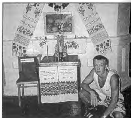
Ikona czyli obraz cerkiewny

Nazajutrz zwiedzamy miasto - Krzemieniec nad Ikwą, w dawnym woj. wołyńskim /dziś Ukraina/. Historia bardzo ciekawa : ongiś był ruskim grodem obronnym : w 1240 przerwało tatarskie oblężenie. W XIV w. został podporządkowany Litwie, a w 1366 przeszedł pod władzę Kazimierza Wielkiego. W 1562 Zygmunt I nadał mu prawo magdeburskie, a starostwo krze-