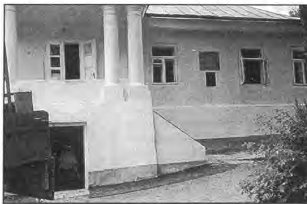
Dworek, w którym urodził się Juliusz Słowacki, obecnie muzeum

mienieckie otrzymała królowa Bona. Obdarzyła miasto wieloma przywilejami, szybko podnosząc jego znaczenie. Politykę tę kontynuowali jej następcy. W 1648