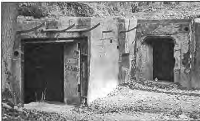
Tak zaś wygląda obiekt 745 przy drodze na Pieski - przez wyajemniczonych jest nazywany "perełką" ze względu na swoje walory zabytkowe i badawcze. Zatem "perełka" w stylu MRU.

Niestety, Międzyrzecki Rejon Umocniony - przepiękny zespół zabytków architektury militarnej mogący przynosić dochody i promować naszą okolicę, poza