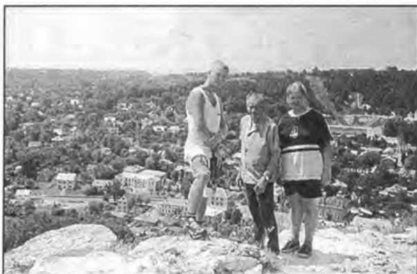
Panorama Krzemieniecka, widok z ruin zamku Bony

W 1922 Liceum zostało odnowione jako zespół szkół gimnazjum, seminarium nauczycielskiego szkoła ćwiczeń, szkoła zawodowa oraz muzeum Juliusza Słowackiego, działało do 1939. Ukończył je m.in. J. Słowacki, J. Korzeniowski, A. Malczewski, S. Worcell.