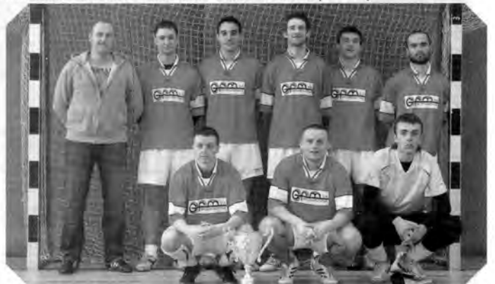
Międzyrzecki Ośrodek Sportu i Wypoczynku

Międzyrzecki Ośrodek Sportu i Wypoczynku zaprasza na pierwsze zebranie organizacyjne przed kolejną edycją rozgrywek Ligi Halowej Piłki Nożnej . Spotkanie przedstawicieli drużyn i osób zainteresowanych udziałem w lidze halowej odbędzie się - 2 września (piątek) o godzinie 18.00 w hali MOSIW na os. Kasztelańskim 8a. Informacje dotyczące rozgrywek sezonu 2011/2012 ponadto będą udzielane w biurze organizatora i pod numerami telefonów: - 95 742 2335 i tel/kom. 501 254 439 . Zapraszamy