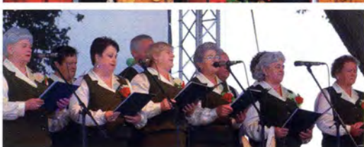
fol. A. Anuszewski

Spolecznościowy Portal Międzyrzecza ZIEMIA MIĘDZYRZECKA www.miedzyrzecz.biz