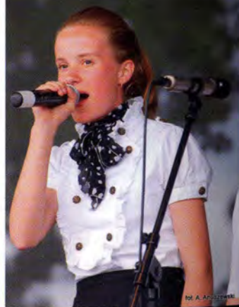
fol. A. Anuszewski