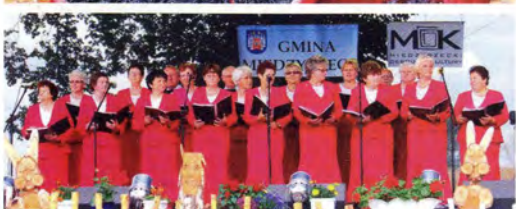
fol. A. Anuszewski