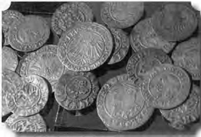
Wybór monet ze skarbu z Zamostowa.

Także 7 monet ze skarbu niestety ubyło w wyniku kradzieży. 4 egzemplarze skradziono w 1971 r., natomiast kolejne 3 przypadły w 1991 r. Z pewno-