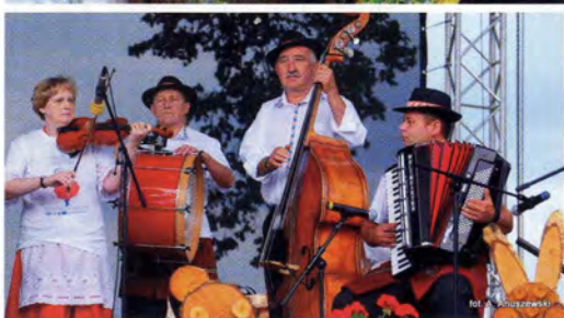
fol. A. Anuszewski