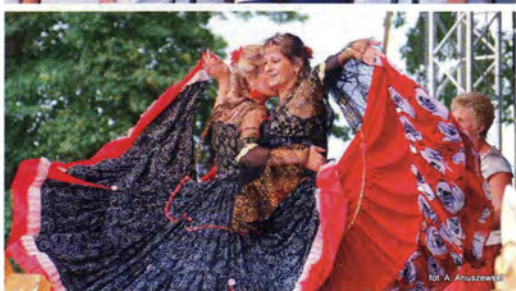
fol. A. Anuszewski