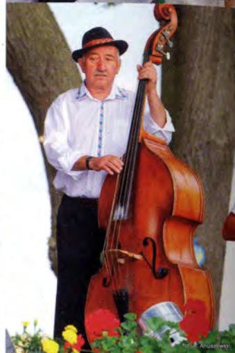
fol. A. Anuszewski