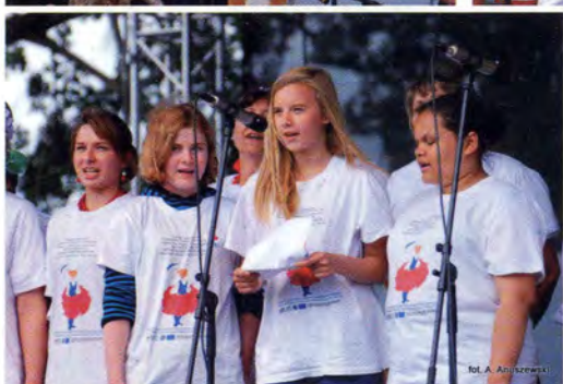
fol. A. Anuszewski