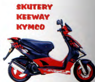
SKUTERY KEEWAY KYMCO