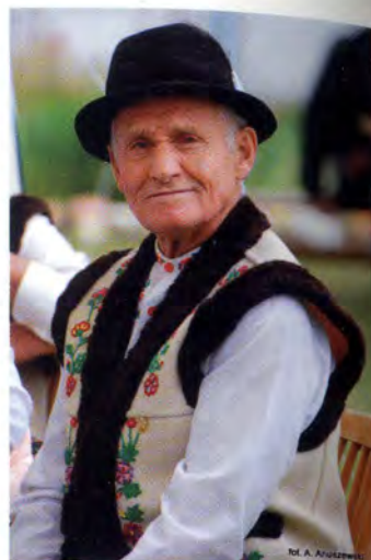
fol. A. Anuszewski