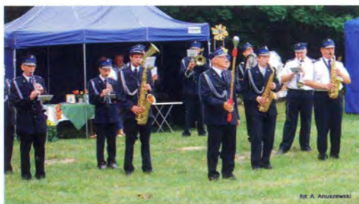
fol. A. Anuszewski