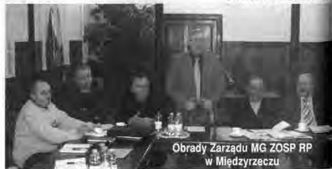
Obrady Zarządu MG ZOSP RP w Międzyrzeczu