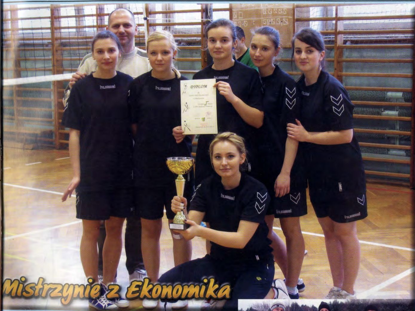
Mistrzyni z Ekonomika