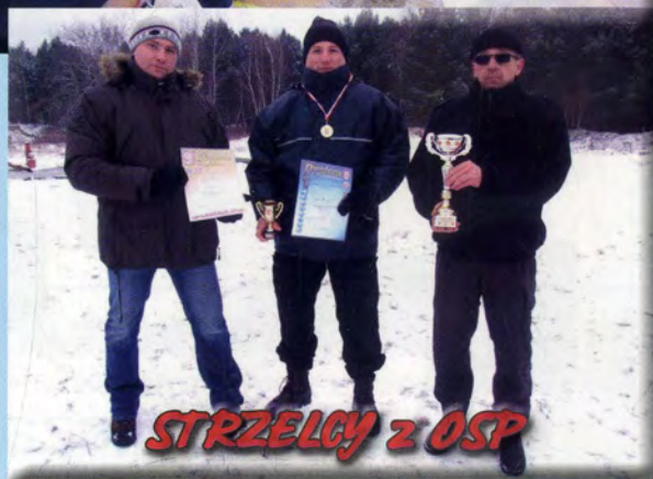
STRZELCY z OSP