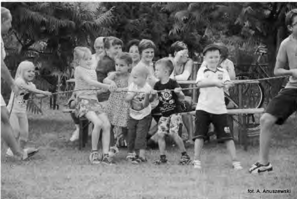
fol. A. Anuszewski