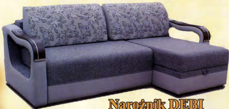
Narożnik DEBI cena 1.999 zł