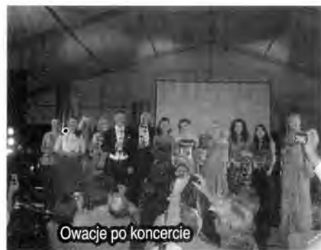
Owacje po koncercie

- boskie głosy. Jak balsam dla duszy powodowały, że publiczność chłonęła ten dar wszystkimi zmysłami. Repertuar klasyczny od oper i operetek po musicale i muzykę filmową min.: Johanna Strausa, Franza Lehera, Giuseppe Verdiego czy Emmericha Kalmana, Roberta Stolza, Henriego Manciniego. Na finał wystąpili wszyscy wykonawcy w arii Libiamo z opery Traviasta G. Verdiego. Artyści zaprezentowali bardzo wysoki poziom artystyczny. Kwiat młodej polskiej wokalistyki i kwiat na widowni dopełniali się znakomicie. Młodzi artyści chętnie bisowali. Orkiestra rewelacyjnie reagowała na liczne fermaty, dynamikę i ogólnie wyraz artystyczny. Koncert nieco się przeciągnął (ku uciesze publiczności), ale słuchacze wracali zwartą i kilkunastoosobową grupą pełni wrażeń, ze śpiewem na ustach (cichutko, bo cisza nocna) i radością w sercach. Ach cudowne chwile nie mogą trwać w nieskończoność. Żał było wracać z tej urokliwej, przesyconej tyłoma atrakcjami dla ciała, ducha i ucha Krynicy-Zdrój. Myślę, że do zobaczenia już wkrótce.