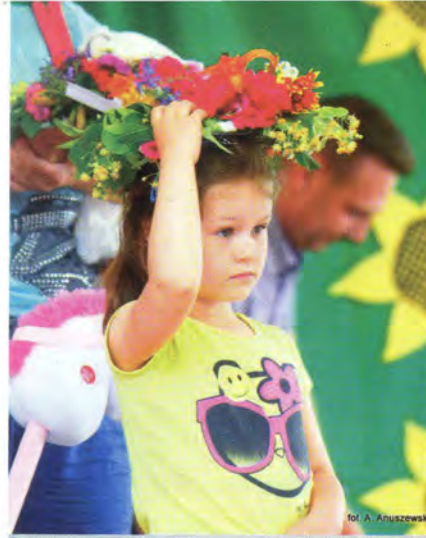
fol. A. Anuszewski