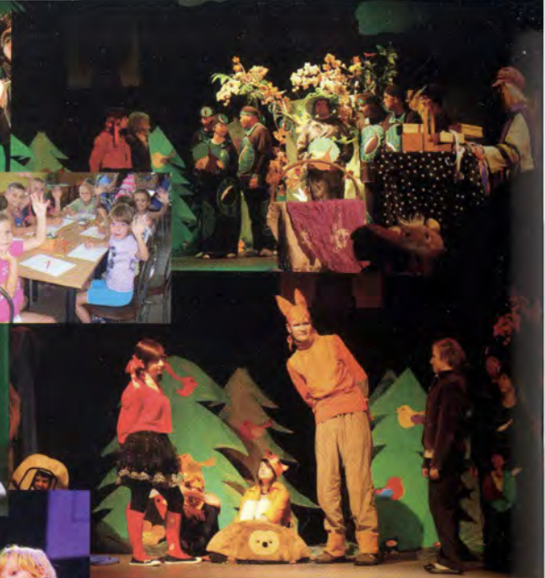
fol. A. Anuszewski