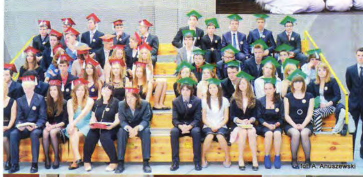
fol. A. Anuszewski