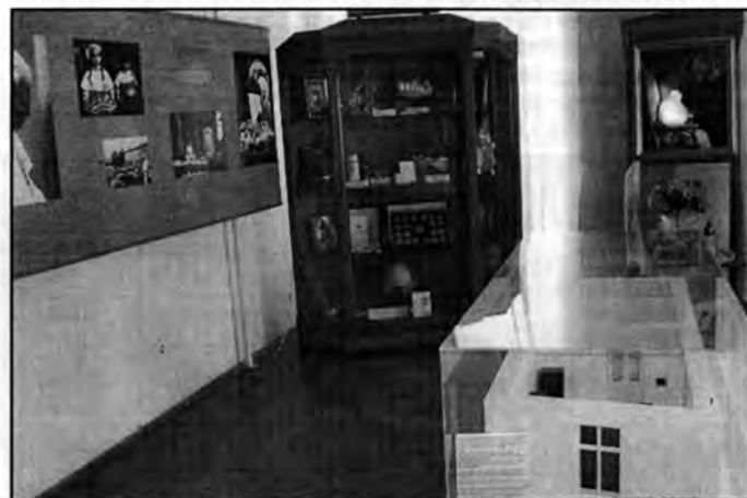
Pokój naszego Papieża - dziś muzeum

Uprzejmie informuję, że zakończenie roku akademickiego organizowane będzie we wtorek 8 czerwca o godz. 14:00 w auli szkoły muzycznej. Zapraszamy słuchaczy i sympatyków MUTW.