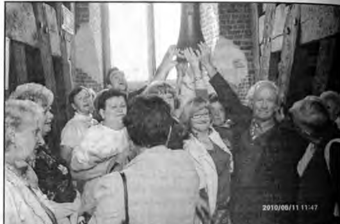
Każdy chciał dotknąć serca Dzwonu Zygmunta