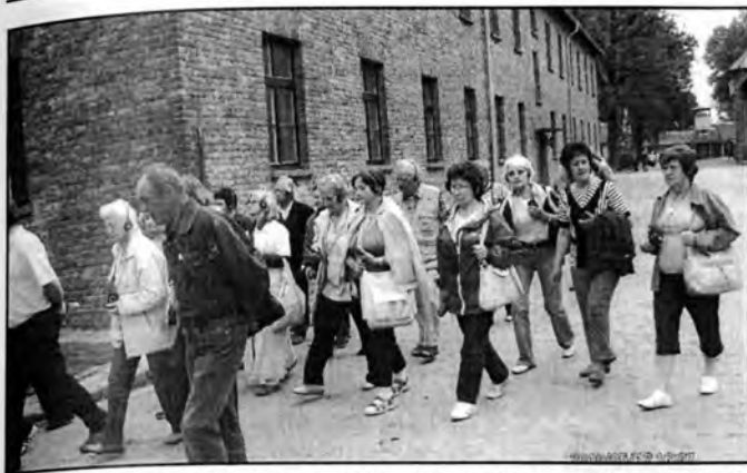
Zwiedzamy obóz Auschwitz - jesteśmy wstrząśnięci