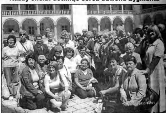
Zwiedzamy Krużganki Pałacu Królewskiego