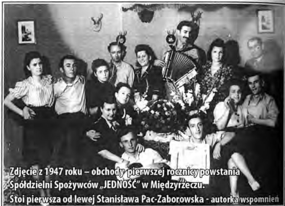
Zdjęcie z 1947 roku – obchody pierwszej rocznicy powstania Spółdzielni Spożyców „JEDNOŚĆ” w Międzyrzeczu.