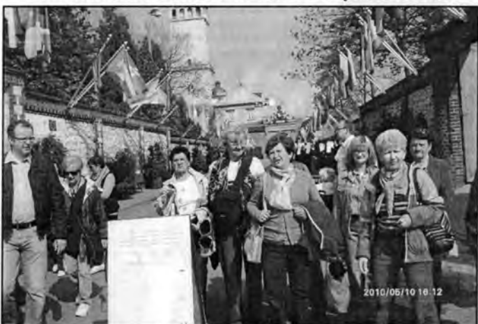
Zwiedzamy Jasną Górę