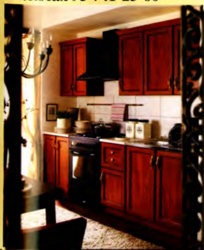
Kuchnia NIKA 180 Ramka - jabłoń ciemna - 929 zł

ul. Reymonta 4 Międzyrzecz tel./fax 95 741-23-60