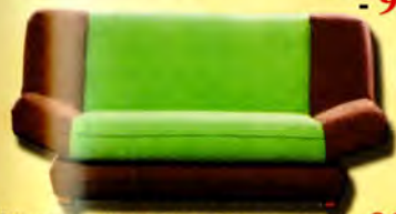
Wersalka BARTOSZ mini - 929 zł