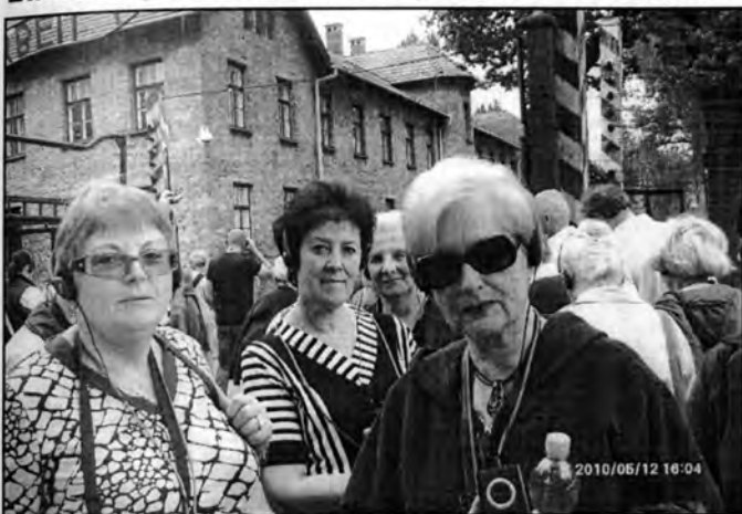
Przed bramą obozu w Oswięcimiu