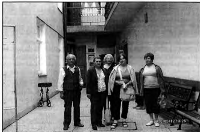
Wadowice - wejście do domu rodzinnego Jana Pawła II