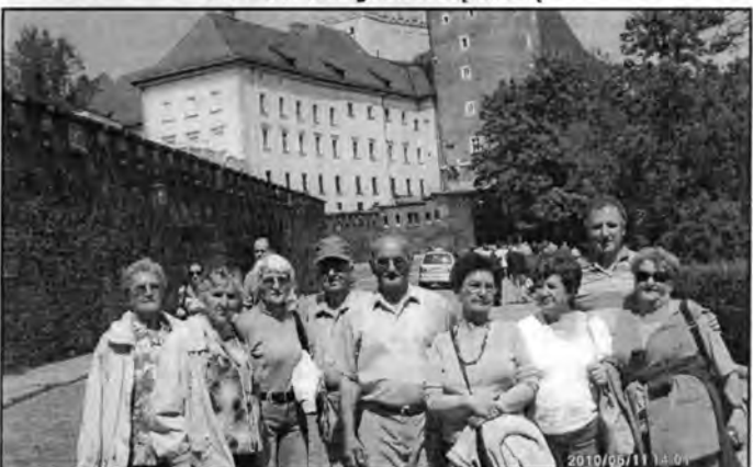
Zwiedzamy Wzgórze Wawelskie