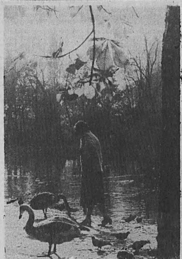
Jeśli na spacer, to tylko do parku — jesienią jest tu najpiękniej.