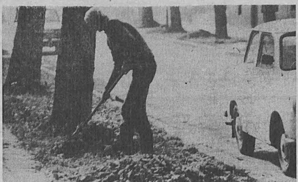
Zdjęcie to upewnia nas, że już naprawdę jesień. Liści więcej na chodnikach, trawnikach, w parkach niż na drzewach. Trzymają się jeszcze liście dębu, ale te opadną dopiero na wiosnę.

Klub Górski "Trawers" zaprasza dziś swoich członków i mieszkańców miasta do klubu spółdzielczego "Uśmiech" przy ulicy Morelowej 34 na spotkanie, którego tematem będą krajobrazy Katalonii. Spotkanie rozpocznie się o godzinie 17.