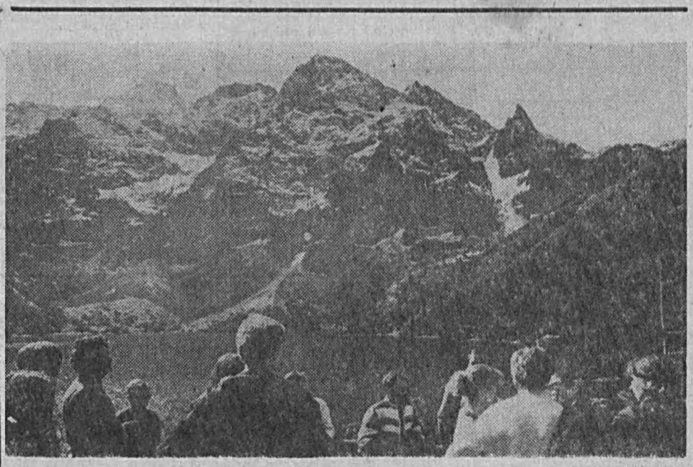
Wyjątkowo piękny listopad sprzyja wycieczkom w Tatry. W planie pobytu nie może zabraknąć wypadu nad «Morskie Oko».

PARYŻ, PAP. Francuskie ministerstwo spraw zagranicznych ogłosiło w sobotę komunikat, w którym podało, że zakończone zostało wycofywanie zarówno francuskich jak i libijskich oddziałów wojskowych z terytorium Czadu. Komunikat zaznacza, że ewakuacja odbyła się zgodnie z porozumieniem zawartym we wrześniu. (Ciąg dalszy na str. 3)