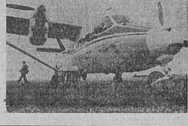
Na zdjęciu: AN-28 stanie się kolejnym samolotem produkowanym przez WSK Mięta i jeszcze jednym efektem współpracy polsko-radzieckiej.

wrótł temat podwyżek i wrędził duże zainteresowanie na sali. — Nauczyciele domagają się zmian lub usupienienia dotychczasowych zasad porównywania swych średnich wynagrodzeń z wynagrodzeniem pracowników inżynieryjno - technicz-