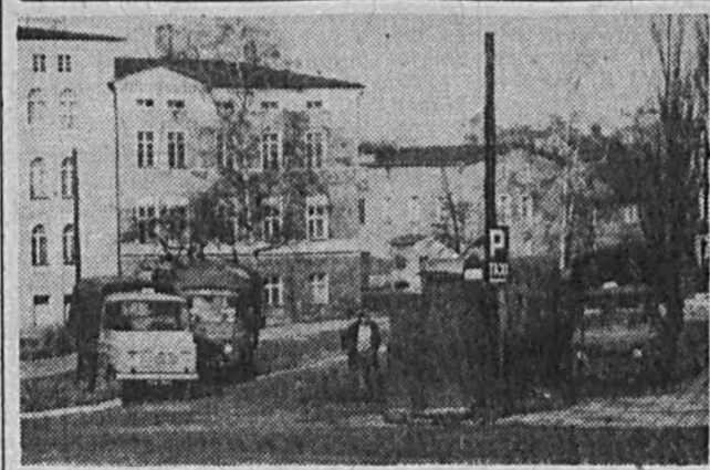
W związku z rozpoczętą inwestycją przy alei Wojska Polskiego, przeniesiono postój taksówek bagażowych... W związku z rozpoczętą inwestycją przy alei Wojska Polskiego, przeniesiono postój taksówek bagażowych...