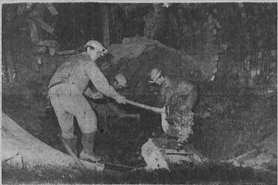
Górnicy z Lubelsko-Chełmskiego Gwarantów Węglowego tradycyjną Barbórką obchodzą w tym roku już po raz dziesiąty. To nasze najstarsze sągłębia potańczę nie bez problemów. Dowiadaliśmy kopalnia w Bogdanie przysporzyła jej wykonawcom wiele trudności, napotkano tu bowiem na skomplikowane warunki geologiczne. Niemniej jednak zabrała prac systematycznie się rozszerza. Każdego dnia wydobywa się w Bogdanie 800 ton węgla, przy równoczesnie prowadzonych pracach budowlanych. Obecnie w całym tym gwarancie pracuje ponad trzy tysiące osób, z których znaczna część stanowiła absolwenci miejscowych zasadniczych szkół górniczych. Na zdjęciu: górnicy z Bogdanki podczas codziennej pracy.

kony i ZSRR - Andriej Gromyko. Głównym tematem obrad jest sytuacja w Europie w związku z ogólnym stanem stosunków międzynarodowych. W poniedziałek rozpoczęło się w Budapeszcie kolejne posiedzenie Komitetu Ministrów (Ciąg dalszy na str. 4)