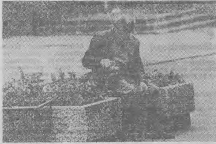
Mają relaks z przyjaciółm.