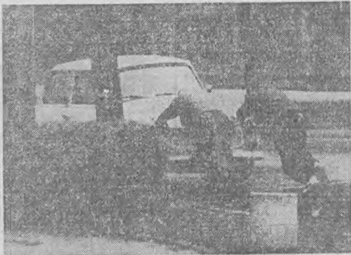
Stary poczciwy trabant odmówił wreszcie posłuszeństwa.