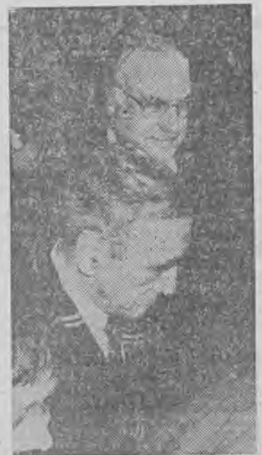
Kanclerz i premier w drodze do restauracji.

— Od dnia zjednoczenia Niemiec jest ośmiokrotnie większy