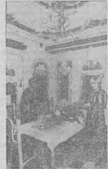
Przy tym stoliku w „Odrze” spotkali się obaj szefowie rządów.