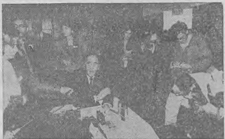
Błyskawiczna konferencja prasowa premiera w Ślubicach.

Niespodziewana wizyta wynikała z chęci przekonania się, jak to