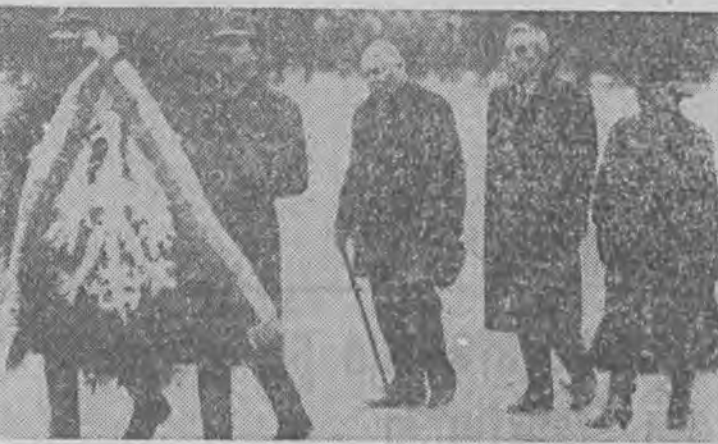
Podczas niedzielnej uroczystej odprawy wart przed Grobem Nieznanego Żołnierza w Warszawie, wieńcem od narodu złożył premier Tadeusz Mazowiecki, marszałek Senatu Andrzej Stelmachowski i wicemarszałek Sejmu Teresa Dobielińska-Eliszewska.