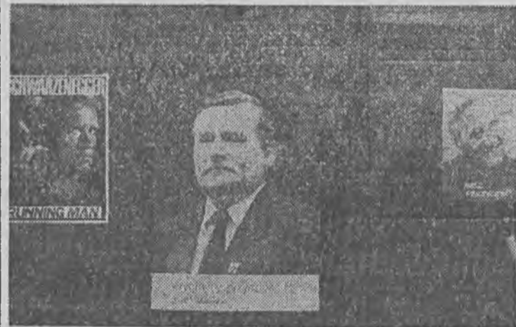
Swoista kampania wyborcza w Krośnie. Od lewej: Mazowiecki, Wałęsa... Schwarzenegger, Wybieraj sam.