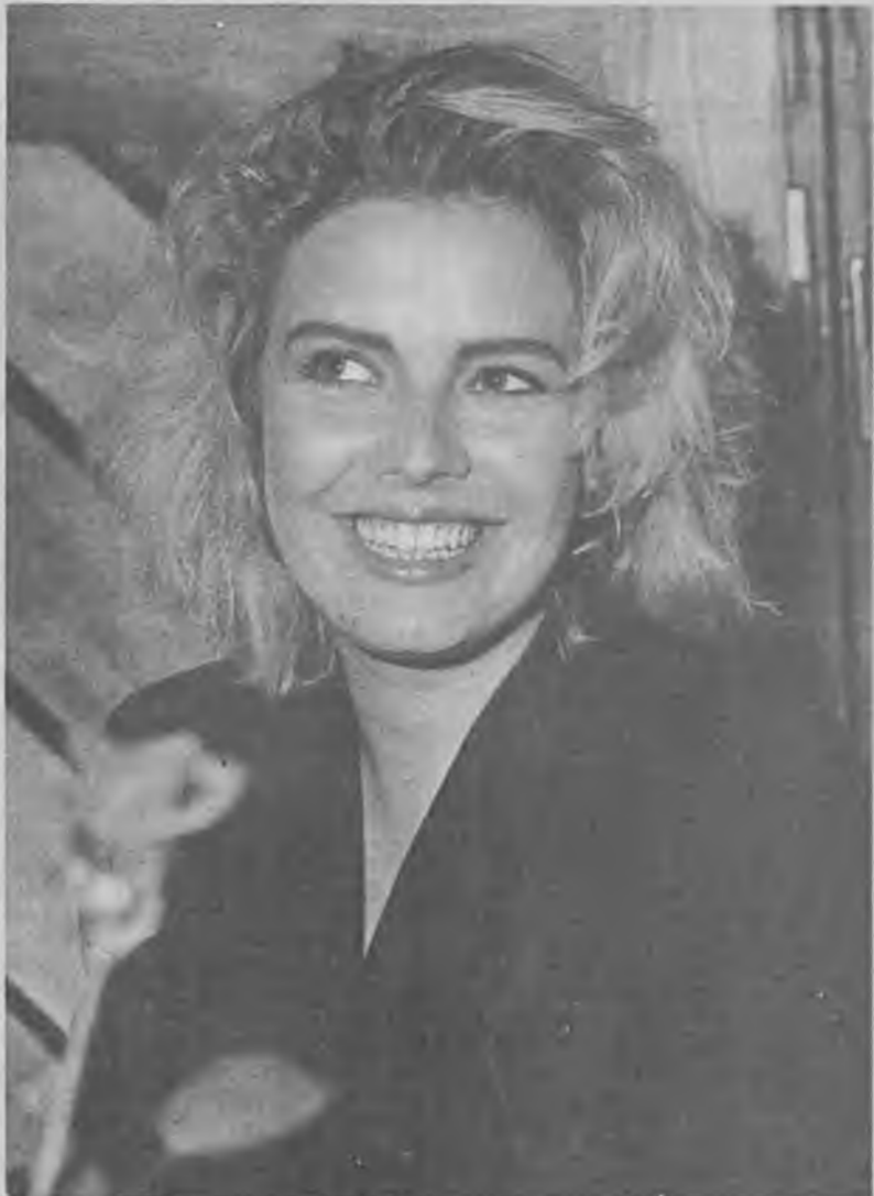
KIM WILDE

tak czy owak - smutne święta. W więziennym radiowęźle elegancka blondynka, z wyłakierowanymi paznokciami, nienagannym makijażem, w zagranicznych ciuchach - zgadza się na szczerą... uczciwą rozmowę. Zabiłam. Mam poczucie winy. Musiałam ponieść karę. Dwanaście lat więzienia. Jeśli ten wyrok jest dla człowieka - to dostałam za mało. Ale jak dla matki i żony - to za dużo. Skazana? Nie, to mi nic nie mówi. No bo, na co skazana? Pozbawiona wolności - wszystko na ten temat. Ani minutowo, ani plusów. Przerwa w życiu. Powiedziałam sobie: idę do więzienia, tu się zamknęła furka. Trzeba się przystosować, nawet jeśli współwięźniarki są niższe poziomem. Na wolności nawet bym z nimi nie rozmawiała. Mówiłam sobie - jeśli chcesz coś osiągnąć, tu w środku, to osiągniesz to w więzieniu też. Kiedyś się wyprostujesz, tylko musisz się wczuć w odsiadkę kary. Większość pozbawionych nie chce powrócić do wolności, bo się boją. W więzieniu, nie poza marginesem. Dla takich wolność znaczy dużo, ale ona jest dla nich tu, w Krzywańcu. Dla mnie nawet wideo w Krzywańcu nie będzie wolnością. Półtora roku pracowałam nad sobą, żeby wyeliminować życie spoza krat. Odbierałam listy na zimno, nie wrzucając się na przepustkach. To chyba jednak wyjątkowa. Boję się, że już na wolności może mi się nie udać wrócić do siebie. Chciałabym na powrót kochać kogoś. To nie strach, ale wstyd powoduje wewnętrzne zamknięcie. A ten głę-