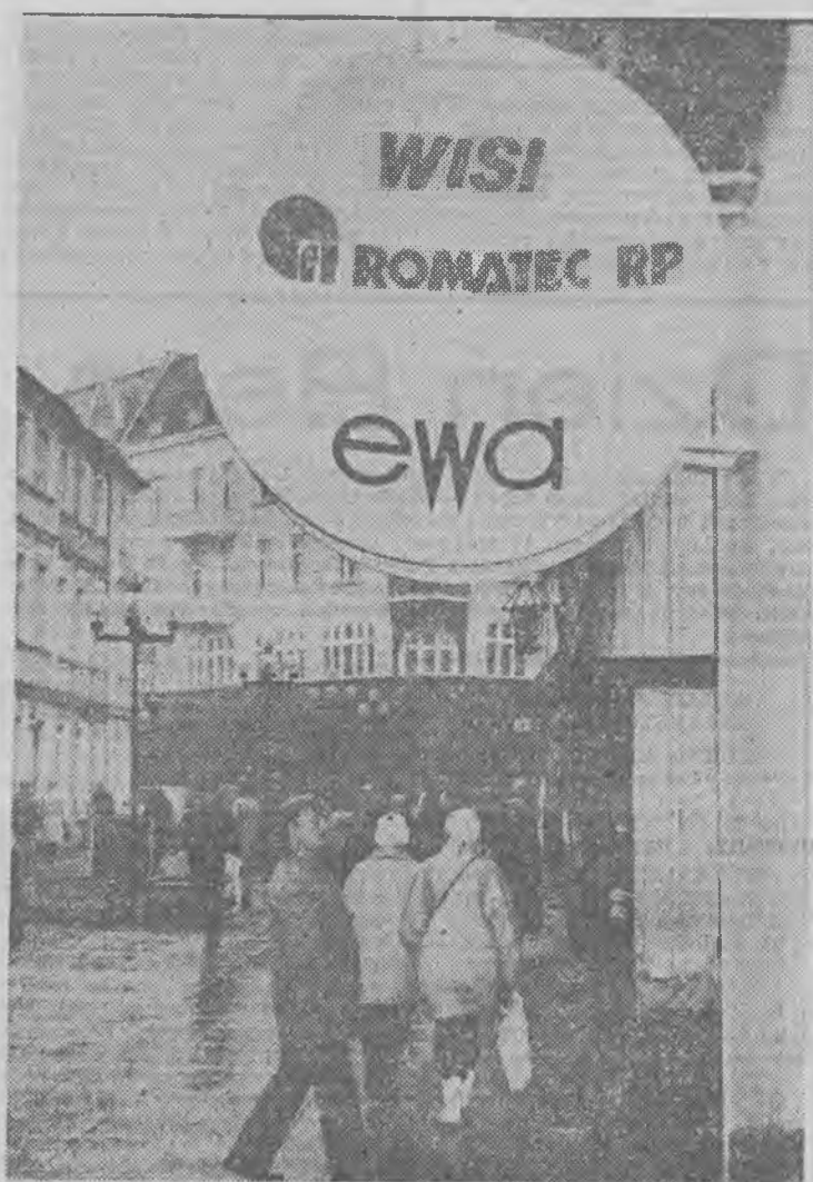
Dlaczego „Ewa” WISI?

Komenda Rejonowa Policji w Zielonej Górze prowadzi śledztwo w sprawie napadu rabunko-wego, który miał miejsce w paź-dzierniku 1990 r. w rejonie ul. Wiśniowej w Zielonej Górze. Osoba pokrzywdzona policja prosi o kontakt z KRP w Zielonej Górze, ul. Partyzantów 40, tel. 616-16, wew. 291, pokój nr 111, w godz. 8-16.