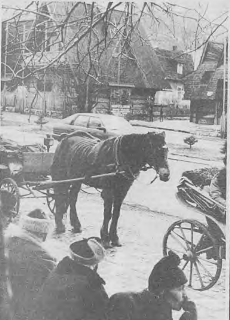
Fiakrzy spod Giewontu czekając na klientów wspominają czasy, gdy Zakopane było naprawdę zimową stolicą Polski.

ZDROWIA JEST ZŁY PROSZE WSZYSTKICH LUDZI DOBREJ WOLI NIE OBOJETNYCH NA CU- DZIE NIESZCZĘŚCIE O WSPAR- CIE FINASOWE ONO POMOŻE MI NA DALSZE PRZEŻYĆ O- RAZ W CZASIE TEJ CHORO- BY PONIEWAŻ LEK JEST PO- CHODZENIA ZAGRANICZNEGO I JEST BARDZO KOSZTOWNY. DZIĘKUJĘ BARDZO!