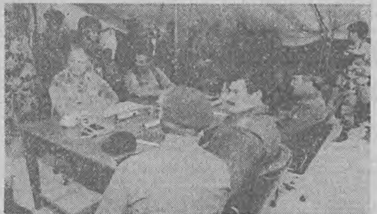
Dowódcy obu walczących stron omawiają warunki rozejmu.

Zródła wojskowe USA podały, że alianci uwolnią dziś 300 irackich jeńców wojennych. Będzie to odpowiedź na decyzję Iraku o uwolnieniu 10 amerykańskich żołnierzy i lotników, którzy zostali przekazani w poniedziałek Komitetowi Czerwonego Krzyża w Bagdadzie.