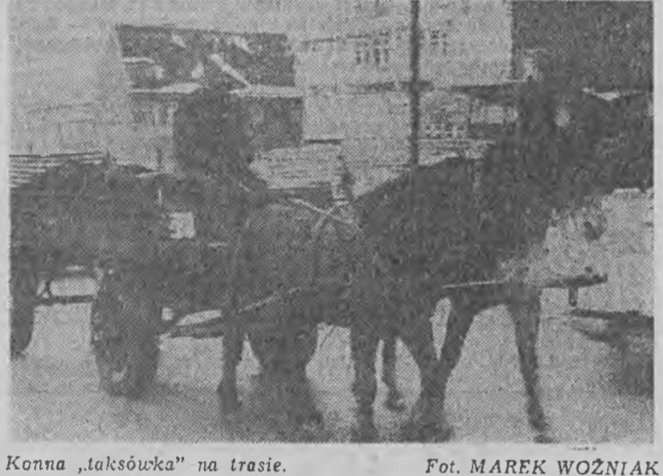
Konna „taksówka” na trasie.

Potencjalny pasażer tzw. „dzikiej taksówki” (a tych ostatnich jest w Zielonej Górze coraz więcej) nawet w przypadku uzasadnionych zastrzeżeń do jej kierowcy, utracił możliwość zgłoszenia skargi do zawodowej organizacji taksówkarzy. Obowiązująca ustawa zniósła bowiem wymóg zrzeszenia się taksówkarzy. Wpis do ewidencji wykonujących ten zawód nie wymaga obecnie przedłożenia dowodu posiadania jakichkolwiek kwalifikacji. Doprowadziło to w konsekwencji do zniesienia takich wymogów kwalifikacyjnych jak: 3-letni staż zawodowy, przeprowadzenie badań lekarskich i psychotronicznych, niekaralność, znajomość topografii miasta i regionu oraz wywołało niezadowolone ze strony kierowców należących do Zrzeszenia Transportu Prywatnego. Wytykają oni niezrzeszonym (na terenie Zielonej Góry są to głównie renciści) brak poszanowania przepisów wewnętrznych. W zrzeszeniu zarejestrowanych jest łącznie (na terenie miasta i województwa) 730 taksówek osobowych, 228 bagażowych, 175 ciężarowych i jeden przewoźnik z transportem konnym. W najbliższym czasie na terenie Zielonej Góry ma przybyć kilka nowych postojów. Jest to potrzebne szczególnie na nowych osiedlach. Zielonogórscy zrzeszeniowcy czekają teraz na nowelizację ustawy, która doprowadzi do wyeliminowania przypadkowych taksówkarzy. (JW)