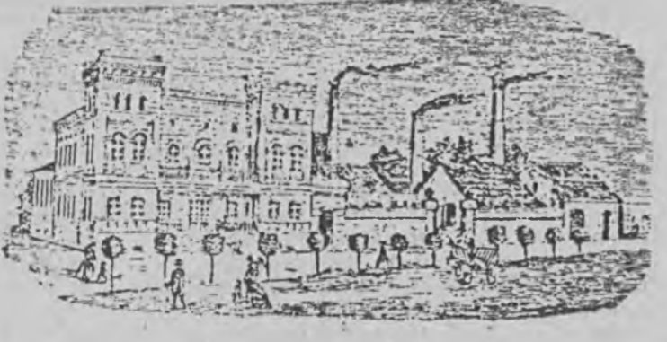
Siedziba firmy „Eduard Seidel” w 1858 roku.