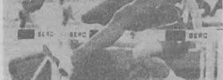
Greg Foster (na zdjęciu) to cała historia biegu przez płotki.

W biegu na 60 m ppł zwyciężył Greg Foster (USA) — 7,45. Wicemistrz drugi 32-letni sprinter amerykański wreszcie dopiął celu i został mistrzem świata.