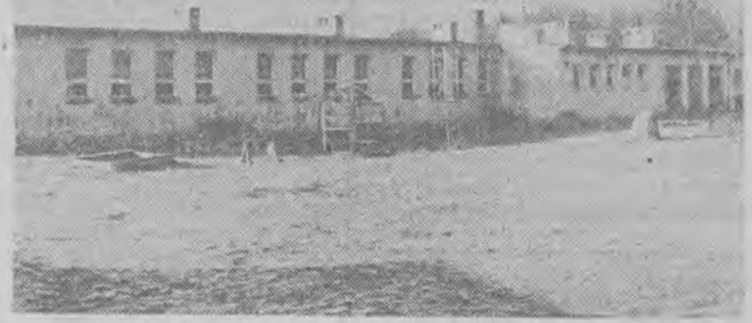
Szkoła Podstawowa w Szczepanowie.