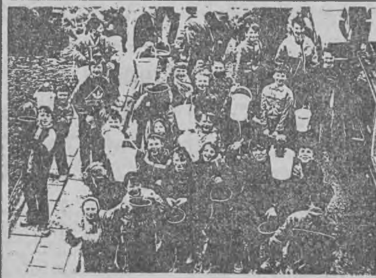
"My chcemy wody!"