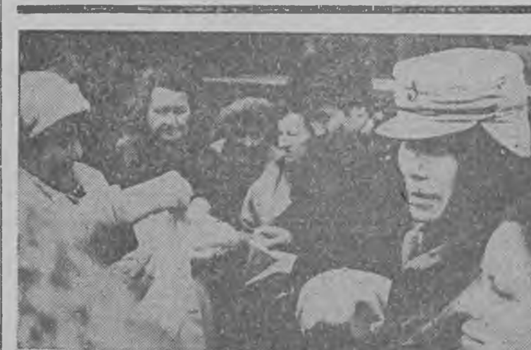
Do handlujących w Zielonej Górze Rosjan i Rumunów dołączyli Wietnamczycy. Sprzedawane przez nich bluzeczki szły jak woda.

Premier stwierdził, że w rozmowie w Belwedrze nie omawiano kwestii jego wizyty w Związku Radzieckim. Podkreślił jednak, że jego podróż do Moskwy ma na celu zachowanie dobrosąsiedzkich stosunków z ZSRR przy równoczesnym otwarciu Polski w stronę Wspólnoty Europejskiej. Szukamy też możliwości ożywienia współpracy gospodarczej z Związkiem Radzieckim po przejściu na rozliczenia w walutach wymienialnych. (PAP)