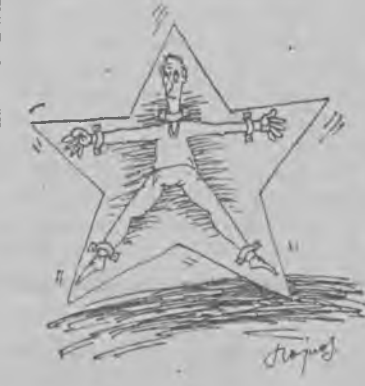
Rys. Mirosław Hajnos