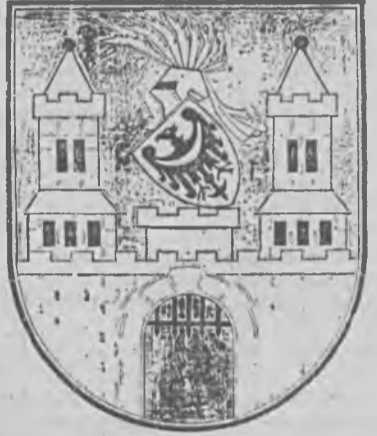
OPIS I KOLORYSTYKA HERBU: