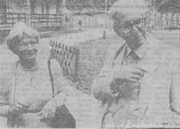
Prof. Jerzy Toeplitz z małżonką