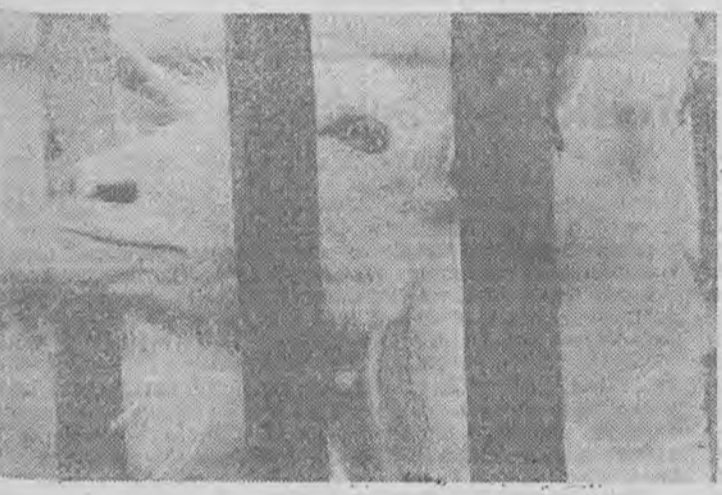
Ona mówi, że kozie mleko jest najzdrowsze.

Apteka w Zbąszyniu jako jedyna w okolicy realizuje jeszcze recepty z 30-procentową odpłatnością, a kolejarzom, funkcjonariuszom MSW, renciście i emerytom wydaje leki bezpłatnie.