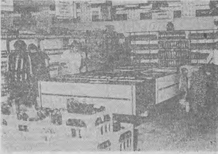
„Faworyt” przyniósł wiele radości krośnianom i dowodzi, że jeśli tylko się chce, można zerwać z handlem prymitywnym.

dni temu szokująca handlowa zmiana, która z pewnością wywrze wpływ na inne sklepy. Narzucono nową jakość i oby udało się ją utrzymać na zawsze.