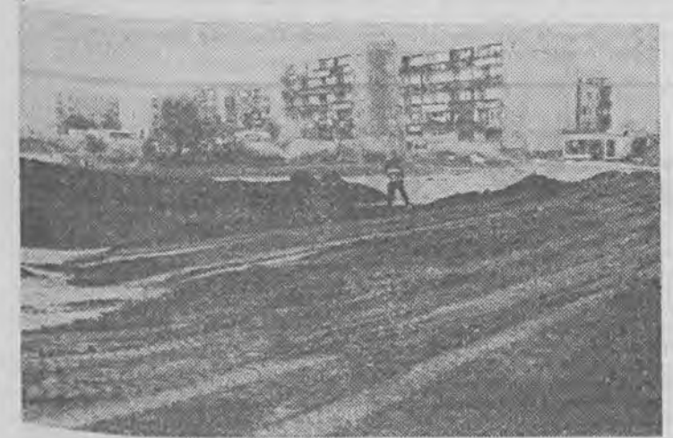
Jeszcze niedawno na placu obok „Sportowca” można było kupić, sprzedać, potargować, a teraz będzie tu parking.

BABIMOST - „Piast” - Sextelefon (USA 18 l.), Magiczny warkocz (chiński 15 l.)