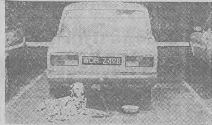
Na parkingu, nad jeziorem Niesłysz pewna rodzina zgotowała swemu "pupilowi" taki los. W dzień śpi obok samochodu natomiast w nocy śpi w samochodzie