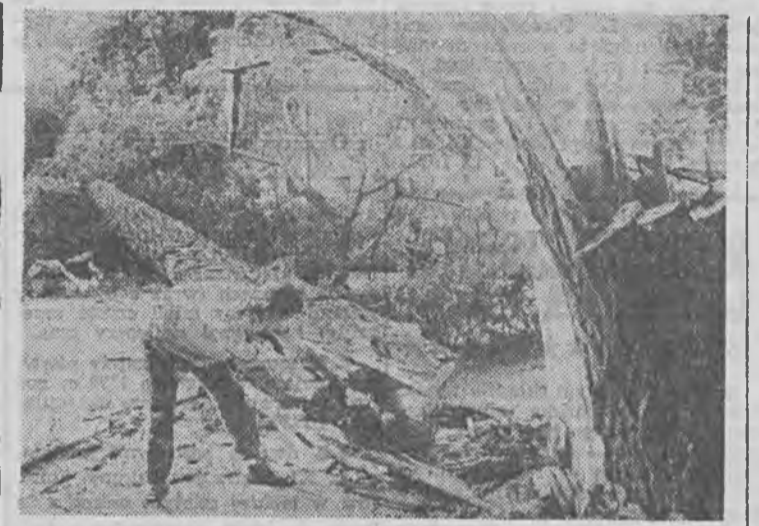
Przy al. Niepodległości zbyt przechylone i zagrażające bezpieczeństwu drzewo...