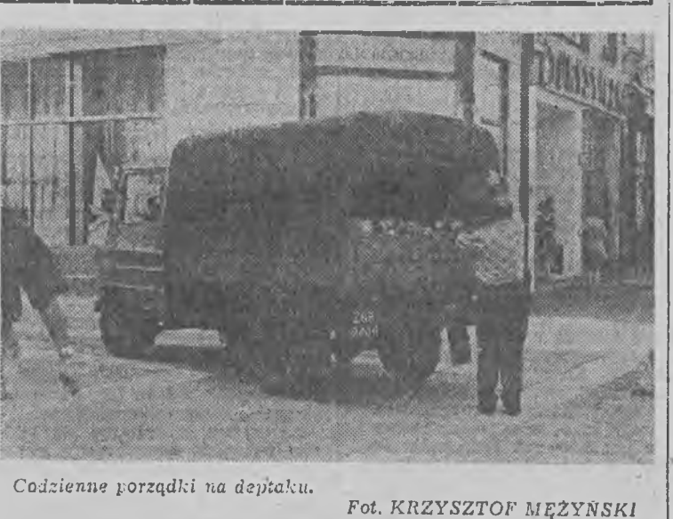
Codziennie prządky na deptaku.