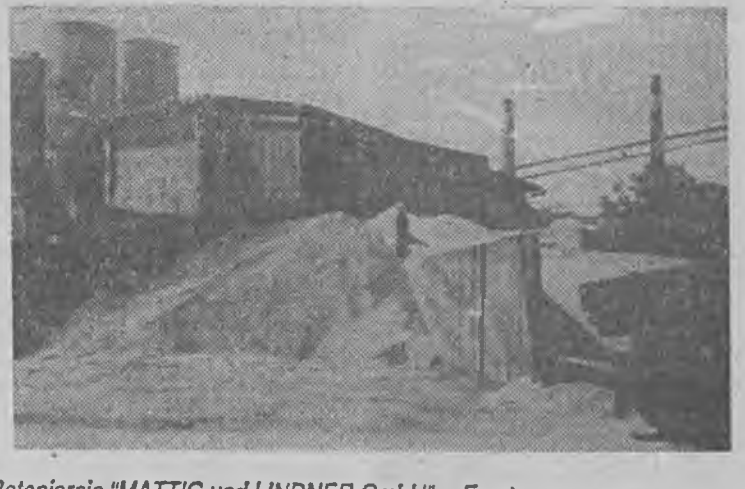
Betoniarnia "MATTIG und LINDNER GmbH" w Forst