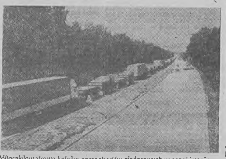
Półorkiometrowa kolejka samochodów ciężarowych w oczekiwaniu na odprawę celną

Z dokumentów przewozowych i spedycyjnych wynika, że za ładunek 24 ton piasku przewiezionego przez Waldka strona niemiecka zapłaciła ma... 60 DM, czyli 2,50 DM za 1 tonę, a więc około (licząc markę średnio po 6.400 zł) 16.000 zł za 1 tonę. Tekst i zdjęcia: Zygmunt Dyszczyński