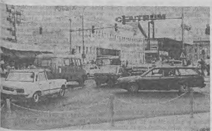
Mały korek w centrum miasta.

ul. Wyszyńskiego 52-37 ul. Podgórzna 226-87 — dworzec 226-66 — bagażówki 226-25