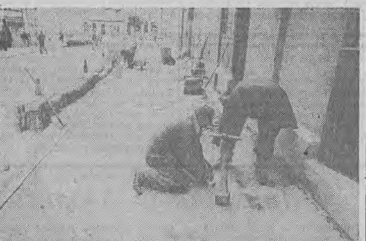
Na ulicy Kościelnej w Wolsztynie wymienia się zniszczone płytki chodnikowe na mozaikę w kolorze ceglarnym. Pracownicy nazywają ją „Klockami Lego”