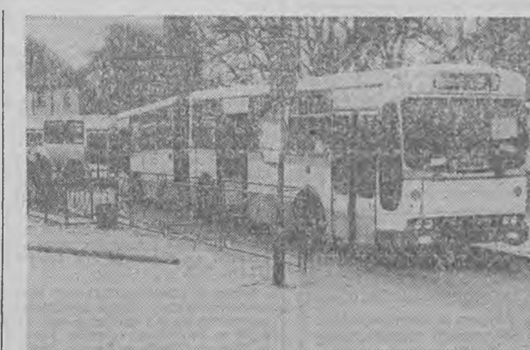
Autobus pełen. Jedziemy!

Wieczorem palilo się w piwni- cy jednego z czteropiętrowych do- mów mieszkalnych na os. Wypo- czynek w Zielonej Górze. Zaalar- mowani strażacy szybko poradzili sobie z ogniem tak, że nie roz- przestrzenił się poza jeden piwni- czny „boks”. Częściowo strawi- łał jedynie drewniane regaly, na- których gospodyni zgromadziła w słoikach smakoliki na zimę. Jak się później wyjaśniło, jej 8- letni syn, który miał przynieść coś z piwnicy do domu, pozosta- wił na regale zapaloną świeczkę. O tym, że zapomniał zgasić, i że- bezpieczniejsza jest latarka - pewnie długo będzie pamiętał. (ew)