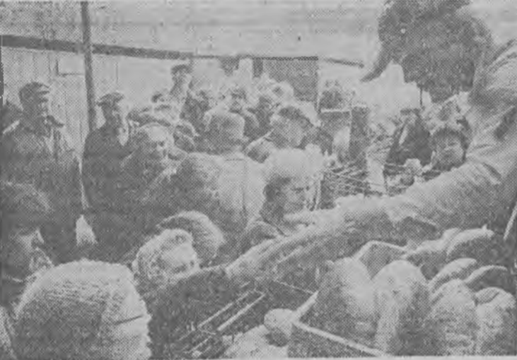
Komu chlebek, komu?!

Najważniejsze jednak, że pierwsze 10 tysięcy egzemplarzy nowego spisu ma trafić do większych placówek pocztowych za kilka dni. Następne partie po 10 tys. dostarczone będą co tydzień.