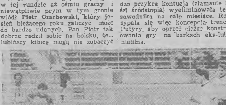
Wiosną w Lubinie przystąpią do gry w piłkę nożną. W tle: trenerzy i zawodnicy Zagłębia Lubin.