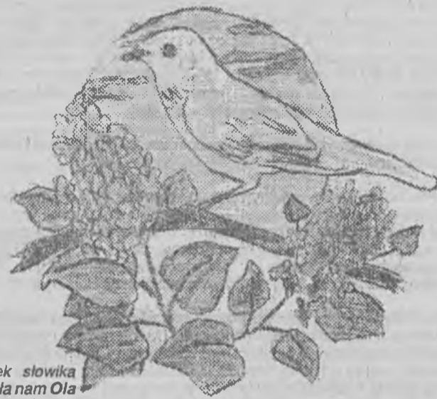
Rysunek słowika przysłała nam Ola Krupa z Białej