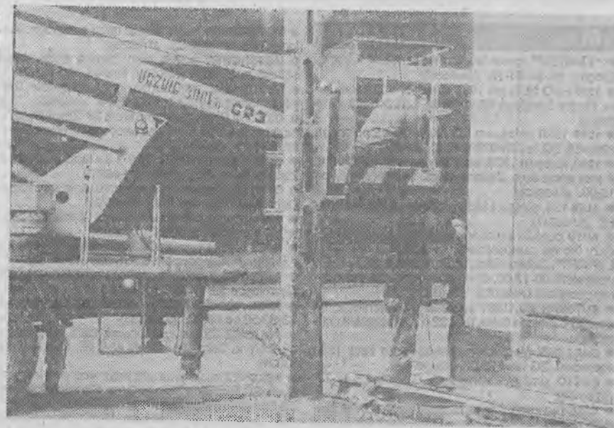
Wymiana rynien na budynku przy ul. Gimnazjalnej w Żarach.