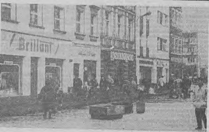
Rynek w Szprotawie. Tu mieszczą się liczne placówki handlowe i usługowe.

Tymczasem już wkrótce — jak podejrzewa burmistrz — Sanepid zacznie egzekwować spore kary. Ciekawe z czyjej kieszeni? (asp)