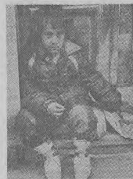
Rumuńskie dziecko w Zielonej Górze. Smutek i niepewność jutra.

Od blisko dwóch lat trwa współpraca między zielonogórskim LO nr 1 i Chrześcijańską Szkołą Gminną w Dokum w Holandii. 10 maja przyjedzie do Zielonej Góry grupa młodzieży holenderskiej, która spędzi dwa dni w mieście i dwa w Karpaczu. W czerwcu grupa uczniów LO nr 1 wyjedzie do Holandii. W skład grupy będzie wchodzić 48 uczniów i 4 opiekunów. W kraju tulipanów przygotowano dla polskich gości atrakcyjny program, między innymi zwiedzanie Amsterdamu i pobyt w oceanarium. (BH)