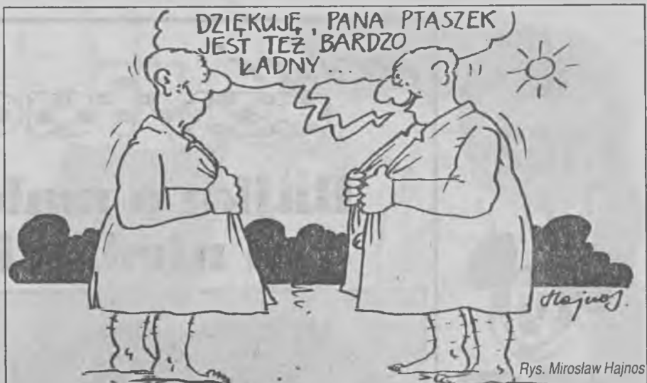
Rys. Mirosław Hajnos

Pierwsze w świecie wyścigi jeży odbyły się w Moskwie. W wyścigach wzięła udział szóstka tych sympatycznych zwierzątek.