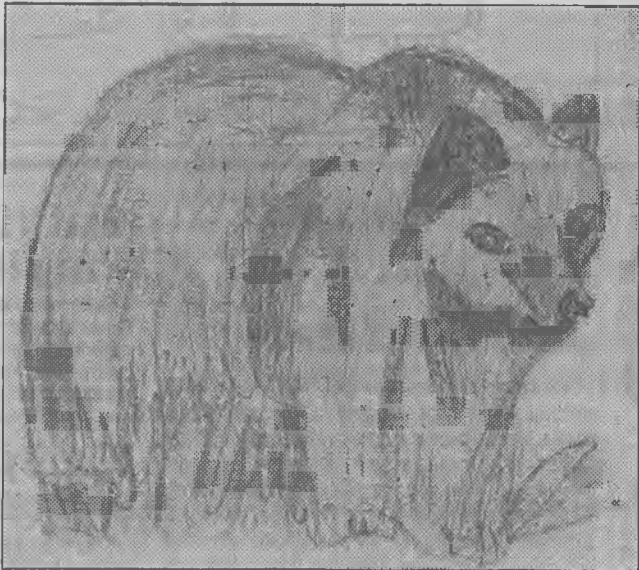
Rysunek Ireneusza Kudelskiego z Lubina

Żyli sobie tatuś i mamusia. Mieli córeczkę Maszę. Pewnego razu wybrała się Masza z koleżankami na jagody.