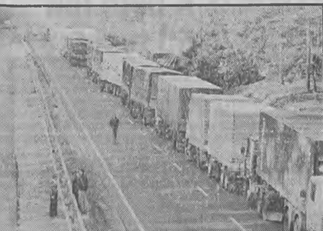
Sytuacja na przejściach polepszyła się tylko nieznacznie. Kierowcy oczekują na wyjazd po kilkanaście godzin.