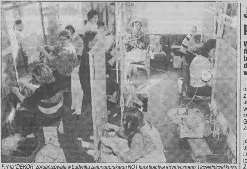
Firma „DEKOR” zorganizowała w budynku zielonogórskiego NOT kursu iktactwa artystycznego. Uczestnicy kursu uczą się w dwóch grupach. Jedną z nich poznaję zawod w przyspieszonym tempie w ciągu trzech miesięcy, drugą grupę ukończy kurs po sześciu miesiącach. Nauka jest bezpłatna.