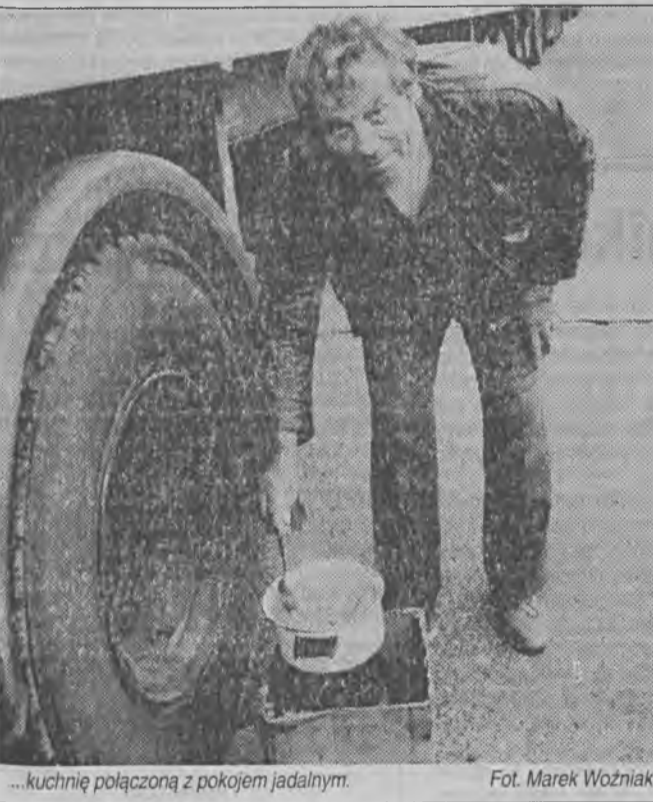
...kuchnię połączoną z pokojem jadalnym.

Dystans, jaki dzieli nas w tej dziedzinie od większości krajów Europy Zachodniej, sięga 25-30 lat. Wkrótce może być jeszcze większy. Ilość zachorowań na gruźlicę systematycznie w Polsce malała w ostatnim czterdziestolecu. Od dwóch lat odnotowuje się jednak wyraźny wzrost liczby chorych.