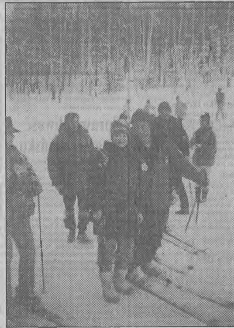
Na wypoczynku w Szklarskiej Porębie Lech Wałęsa fotografował się chętnie w towarzystwie przygodnie spotkanych turystów. Na zdjęciu obejmuje zielonogórzankę pragnącą zachować anonimowość.