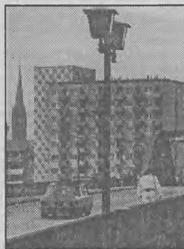
Frankfurt nad Odrą.

— Ilu studentów uczyć się będą w Frankfurt nad Odrą w tym roku?