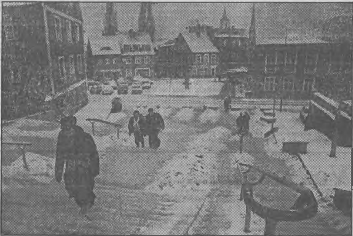
Odwił „idzie” w tym roku dość powoli. Do szczególnie niebezpiecznych miejsc należą schody wiodące od budynku Sądu Wojewódzkiego na deptak.