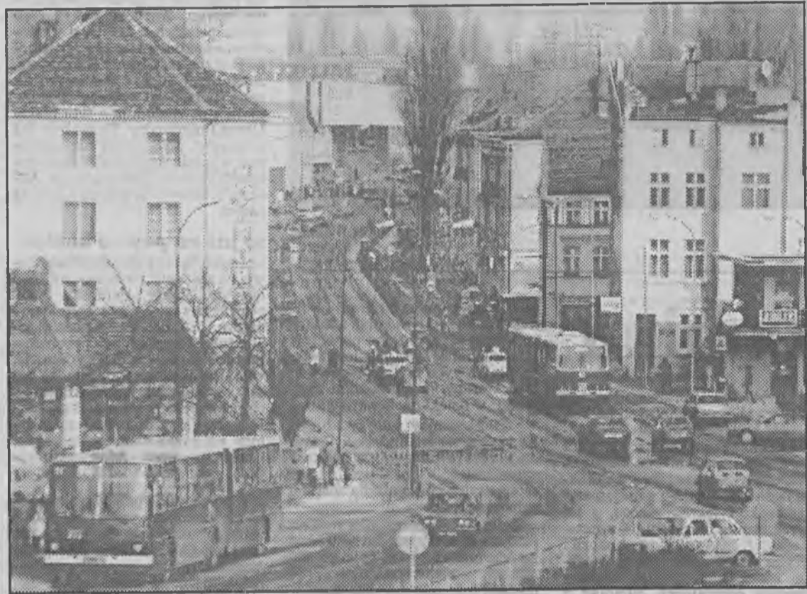
Na reprezentacyjnej ulicy miasta zimy już prawie nie widać.