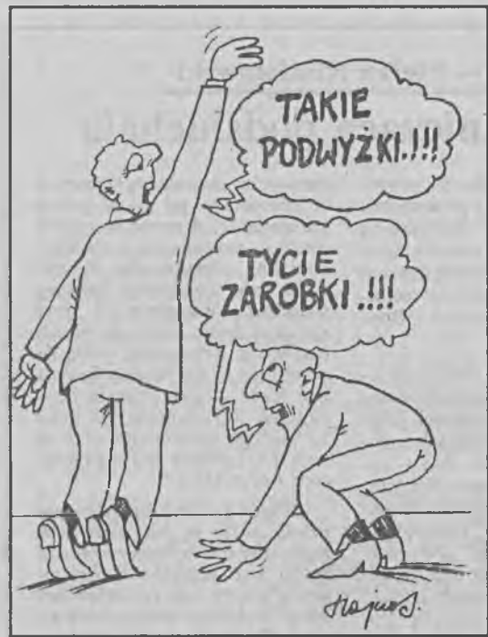
Rys. Mirosław Hajnos

Skutki tej podwyżki na wydatki konsumentów nie będą tak duże, gdyż system odpłatności za leki dotowany jest z budżetu państwa. (PAP)