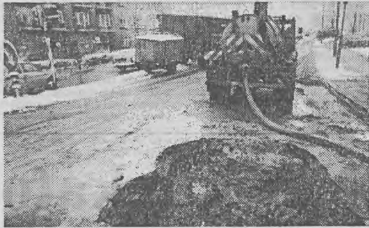
Fot. Marek Woźniak