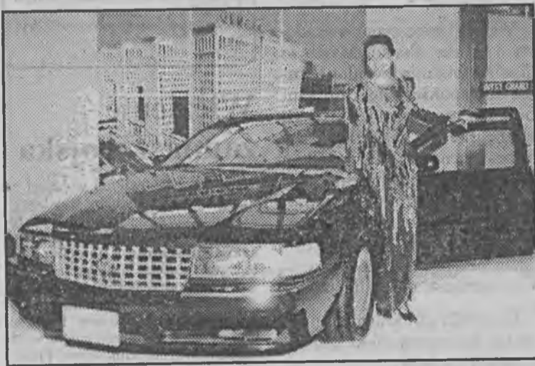
Na targach motoryzacyjnych w Poznaniu panowie z zachwytem oglądają szybkie samochody i piękne dziewczyny. Oto luksusowy cadillac seville (General Motors). Moc 300 KM. Prędkość 250 km/h. W 7 sekund osiąga szybkość 100 km/h. Niestety, General Motors nie podaje danych hostessy.