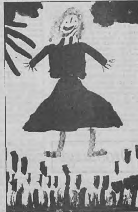
Hania Kurian, lat 6

Za opowiadanie o najpiękniejszym dniu w życiu mamy, nagrody wylosowali: