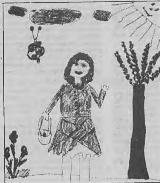
Piotr Bednarski, lat 5

Zwycięzcom i ich mamom serdecznie gratulujemy. Wręczenie nagród odbędzie się we wtorek, 1 czerwca o godz. 16.00 w naszej redakcji w Zielonej Górze (al. Niepodległości 22).