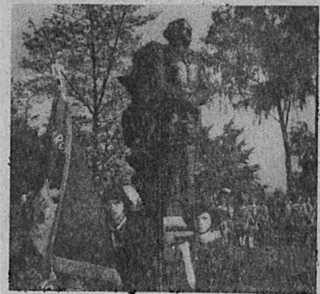
Na zdjęciu: podczas uroczystości odsłonięcia pomnika.