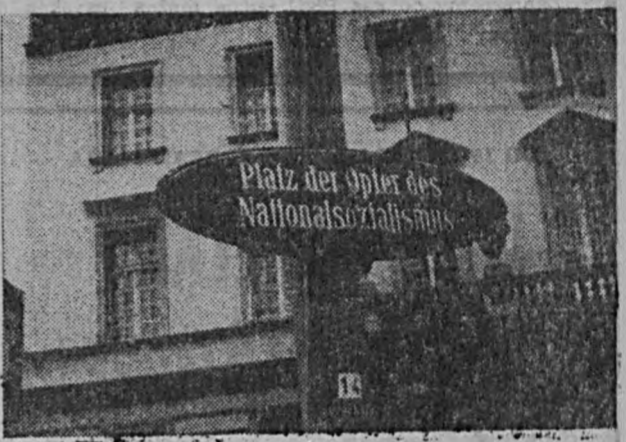
Na pierwszym planie tabliczka z napisem „Plac Ofiar Narodowego Socjalizmu”. Na drugim planie jeden z domów przy Oskar-von-Miller Ringu.

Zdołem się i na to, by zapytać po kolei kilku przechodniów, gdzie ten „Plac