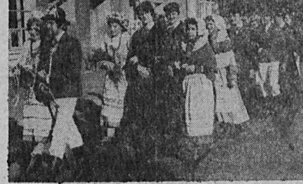
Orszak ślubny rozbudził ciekawość. Młodzi wraz z całym zespołem poszli złożyć kwiaty przed obeliskiem w parku.

Trzeba wypadła pomyslnie. Już wszystkie spisane, młodzi idą do sali ślubów. Powtarzają słowa ślubowania za