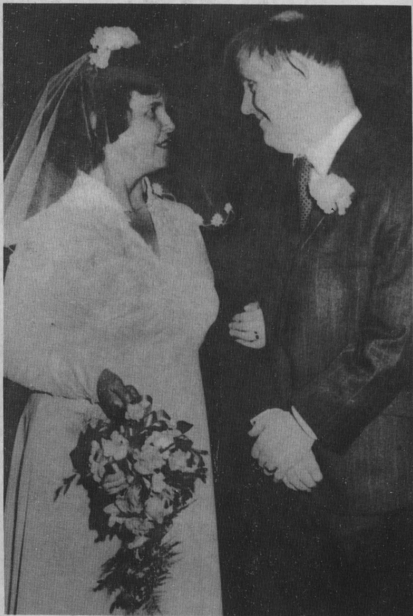
PAN I PANI ROTHWELL — LISTOPAD 1981