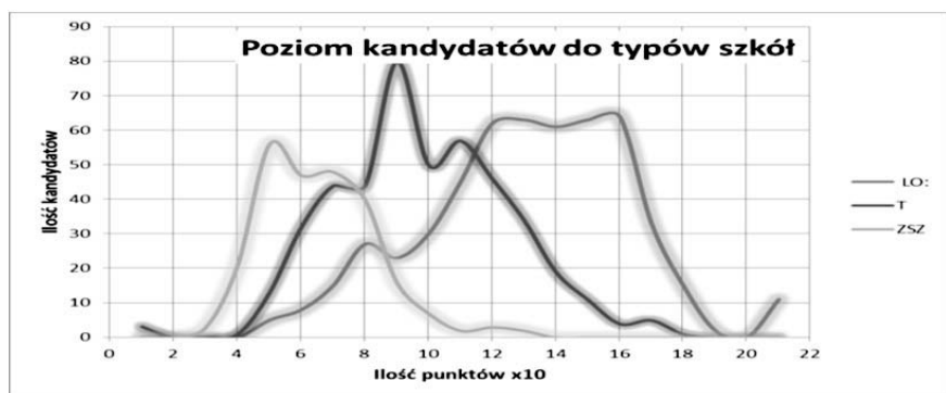
Wykres 2. Wyniki egzaminów gimnazjalnych.