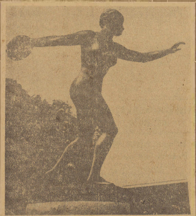
Sport cieszy się w Związku Radzieckim olbrzymią popularnością. Pomniki poświęcone kultowi fizycznej znajdują się prawie w każdym parku czy zieleńcu na terenie ZSRR. Oto posąg dyskobolki w parku na przedmieściu robotniczego Tom-ska.

najmłodszych. Uprawiają go w Gruzji, Azerbejdżanu, Armenii, Tadżykistanu, Uz-