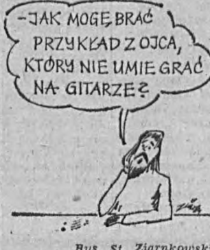
Rys. St. Ziarnkowski

w miejscowości Olszynie gm. Żary, kierowca Trabanta będący w stanie po użyciu alkoholu nie opanował pojazdu i uderzył w przydrożne drzewo. Wskutek wypadku pasażer siedzący na przednim siedzeniu poniósł śmierć na miejscu, a kierowca z obrażeniami został odwieziony do szpitala. W minionym tygodniu służba ruchu drogowego MO ujawniła około 1300 wykroczeń w ruchu drogowym, za które 707 osób ukarano mandatai karnymi oraz 512 osób pouczono. Sporządzono 43 wnioski o ukaranie do kolegiów ds. wykroczeń. Załrmano 14 kierujących pojazdami w stanie po użyciu alkoholu — którym zatrzymano prawo jazdy. Za usterki zagrożone bezpieczeństwem w ruchu drogowym zatrzymano 62 dowody rejestracyjne, a pojazdy skierowano do badań technicznych.