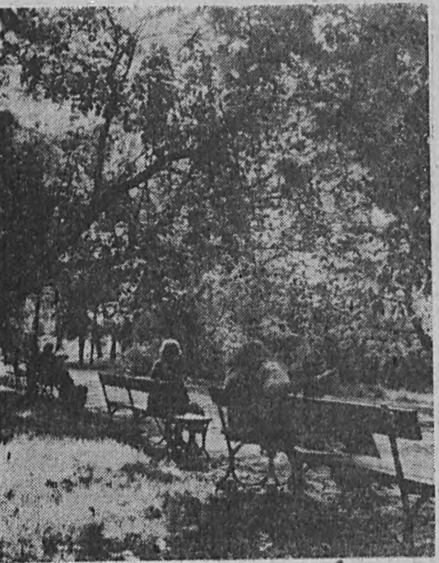
Pogodna jesień sprzyja relaksowi w parku.