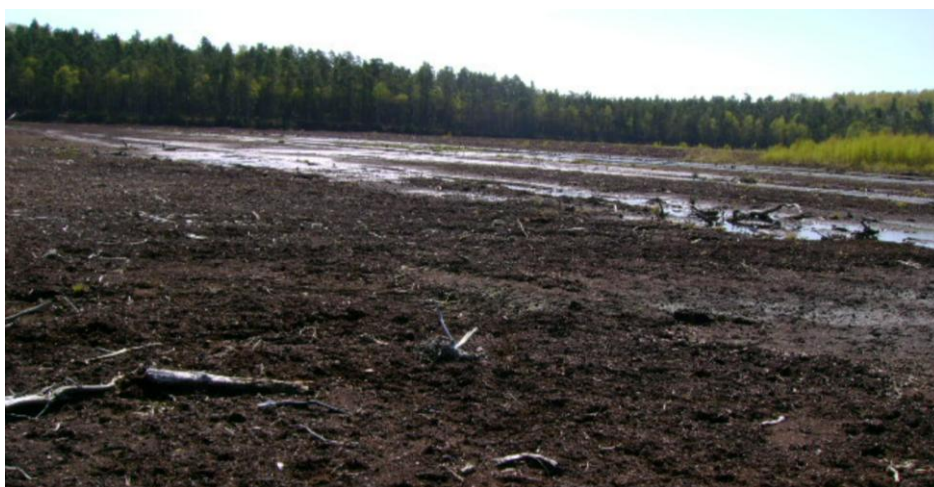
Fot. 1. Odsłonięta powierzchnia spągowego torfu – poziom wody gruntowej przy powierzchni terenu. Dobre warunki do regeneracji procesu torfotwórczego po rekultywacji technicznej

Morfologia i właściwości gleb. W trakcie badań stwierdzono, że teren zrehabilitowanych pól poeksploatacyjnych kopalni „Budwity” jest stosunkowo płaski. W obrębie wyrobiska potorfowego powierzchnię wyrównano mechanicznie (lokalnie występują niewielkie zawodnione dolinki i wyniesienia) oraz oczyszczono z zalegających w złożu pni, a rowy odwadniające zasypano. W wyniku odsłonięcia spągowych warstw złoża, powstały płytkie gleby torfowe o miąższości warstwy organicznej (torfy przejściowe i niskie) ok. 50 cm (fot. 1). Podłożem ich jest utwór mineralny, najczęściej piasek, rzadziej gytia detrytusowa. Profil glebowy jest znacznie uwodniony, miejscami w lokalnych dolinkach z wodą stagnującą na powierzchni.