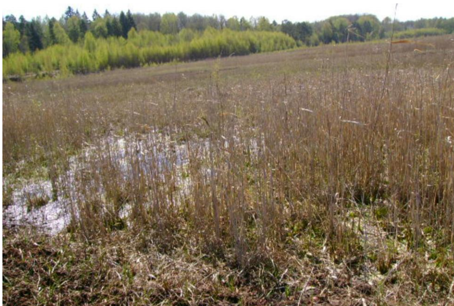
Fot. 2. Wypełnione wodą dolinki pokryte trzciną pospolitą ( Phragmites australis (Cav.) Trin. ex Steud) i torfowcem spiczastolistnym ( Sphagnum cuspidatum Ehrh. ex Hoffm.)

naturalnego złoża w rezerwacie. W obu przypadkach porowatość ogólna przekracza 90%, i świadczy o dużej pojemności wodnej tych utworów. Powierzchniowe zawodnienie w lokalnych dolinkach powoduje, że wilgotność aktualna dorównuje porowatości ogólnej. Na obszarze całego torfowiska „Budwity” odczyn torfów jest silnie kwaśny. W stosunku do rezerwatu, odsłonięte torfy w wyrobisku poeksploatacyjnym, charakteryzują się wyższym odczynem i zawartością N-ogólnego oraz niższą C-organicznego. Stosunek C:N jest istotnym wskaźnikiem przemian materii organicznej. Zarówno w przypadku gleb na terenie rezerwatu, jak i w wyrobisku potorfowym jest on bardzo szeroki i wynosi 46, 72-56, 79. Tak szeroki stosunek C:N świadczy, że istniejące warunki w tych siedliskach nie sprzyjają przemianom materii organicznej i mineralizacji organicznych związków azotu. Nieznacznie korzystniejsze warunki do mineralizacyjnych przemian azotu w glebach pól poeksploatacyjnych kopalni niż rezerwatu, wynikają z odmiennych rodzajów torfu. Eksploatując złoża odsłonięto bowiem spągowe torfy niskie i przejściowe.