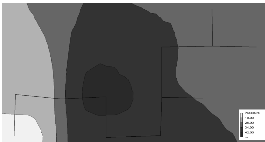
Rys. 3. Ciśnienie w sieci wodociągowej (stan początkowy) Fig. 3. Contour plot of pressure (initial state)

Po kilku latach eksploatacji nastąpiła rozbudowa sieci i zwiększenie o połowę rozbiorów wody w miejscowościach Głogówko i Kulów położonych na końcówkach sieci – zmiany te uwzględniono w kolejnym wariancie obliczeń. Wyniki przedstawiono na rys. 4. W węzłach 5, 6 i 7 obliczenia wykazały wartości ciśnienia na tyle niskie, że czerpanie wody z instalacji wewnętrznych podczas godzin wysokich rozbiorów wody było niemożliwe – w dużej części analizowanego terenu ciśnienie nie przekracza 18 m. Niske wartości prędkości przepływu wody w sieci powodują konieczność płukania sieci.