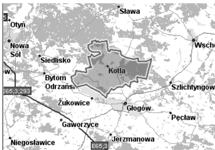
Rys. 1. Lokalizacja gminy Kotla Fig. 1. Localisation of Kotla community

Gmina Kotla położona jest w północnej części województwa dolnośląskiego; rzędne terenu na tym obszarze wahają się od 68,2 m n.p.m. (obszar położony wzdłuż koryta rzeki Odry na wysokości wsi Dorzecze) do 100,1 m n.p.m. (teren w północnej części gminy położony na północny – zachód od wsi Krążkówko). Powierzchnia obszaru gminy wynosi 127,75 km 2 , co stanowi około 29% powierzchni powiatu głogowskiego oraz niespełna 1% powierzchni województwa dolnośląskiego (rys. 1).