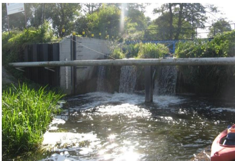
Fot. 1. Jaz – obiekt MRU nr 709 Fig. 1. Jaz - MRU object No. 709

Fig. 1. Location of the study area - Hydrographic Maps developed by Polish - Lubrza sheets, Łagów, Świebodzin Międzyrzecz [Geomat Ltd. Poznań 2005]