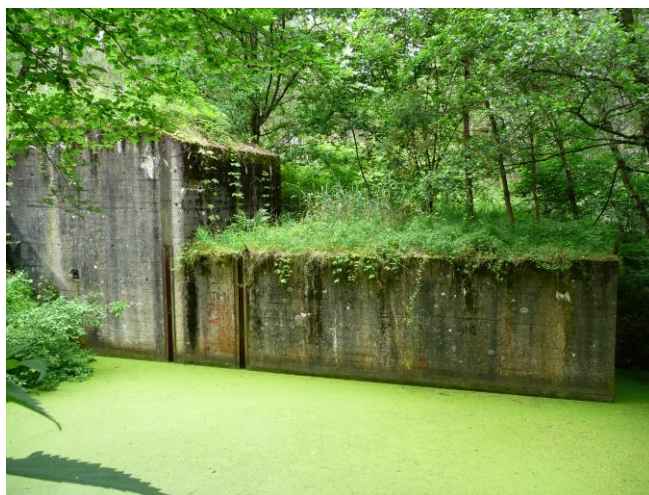
Fot. 3. Jaz – obiekt MRU nr 714 (fot. S. Skomoroko ** ) Fig. 3. Jaz – MRU object No. 714 (phot. S. Skomoroko ** )

Trasa spływu omija go od strony południowej kanałem i zatoką umożliwiającą zwiedzenie obiektu. Następnie, po pokonaniu kolejnego odcinka, o długości około 4 km, w pobliżu ujścia rzeki do Jeziora Paklicko Wielkie (fot. 3) znajduje się kolejny jaz piętrzący (obiekt MRU nr 714).