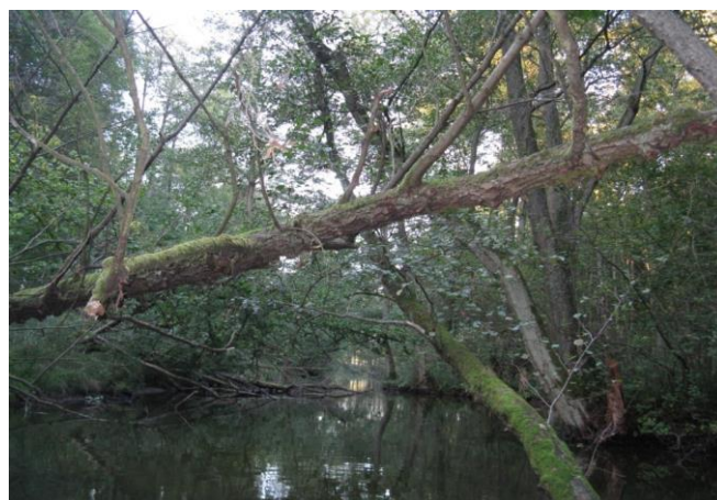
Fot. 5. Rezerwat Dębowy Ostrów Fig. 5. Reserve Oak Ostrów

Spływ kończy się w pobliżu pocysterskiego klasztoru w Gościkowie, na lewym brzegu rzeki.