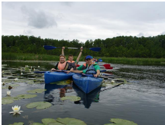
Fot. 4. Jezioro Paklicko Wielkie Fig. 4. Lake Paklicko Wielkie

Po przepłynięciu ok. 2 km po jeziorze Paklicko Wielkie (fot. 4) trasa spływu przebiega korytem rzeki Paklicy, wśród powalonych drzew rezerwatu Dębowy Ostrów (fot. 5).