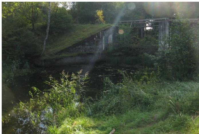
Fot. 2. Jaz – obiekt MRU nr 712 Fig. 2. Jaz – MRU object No. 712

Po przepłynięciu 4 km na północny-wschód, pokonywanych kanałami i zarosniętymi jeziorami (rozlewiskami) napotyka się jaz – obiekt MRU nr 712 (fot. 2).