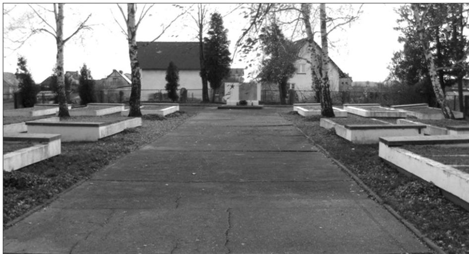
Ryc. 3. Cmentarz w Nowogrodźcu stan obecny

W 2003 roku miasto przeznaczyło na usługi remontowe cmentarza wojennego 1300 zł. Na 2004 rok przewidywano taką samą sumę, a na kolejny rok – o 300 zł mniejszą 17 .