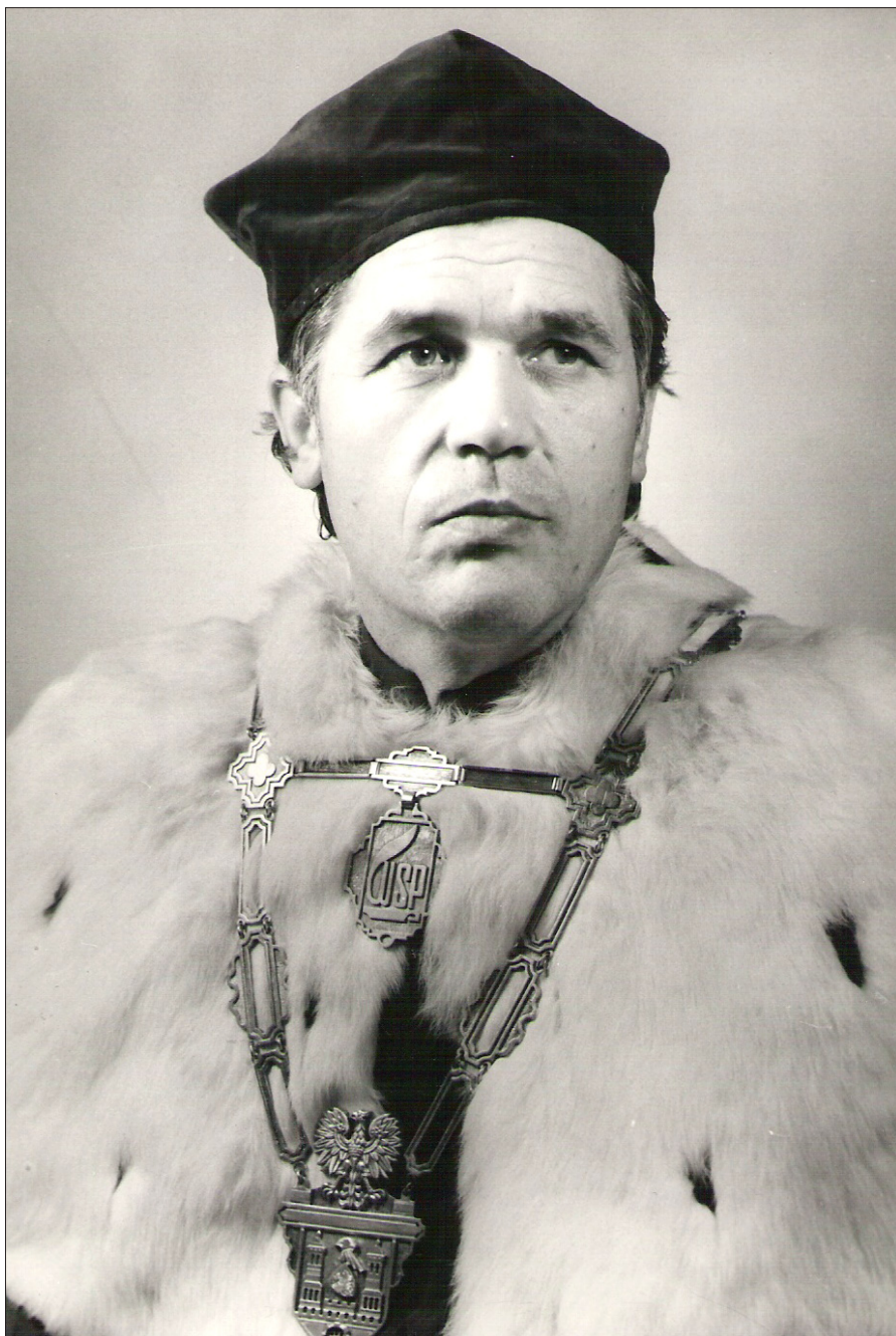
Jako rektor Wyższej Szkoły Pedagogicznej w kadencji 1973-1975