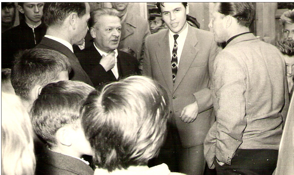
Jako nauczyciel w Technikum Rolniczym z Władysławem Broniewskim, Szprotawa 1962