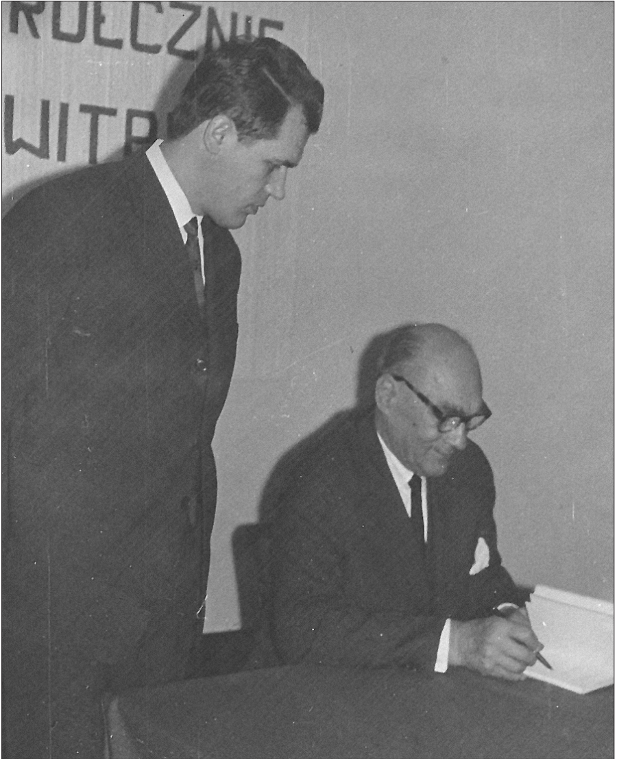
Podczas spotkania studentów WSI z Jarosławem Iwaszkiewiczem, 1966