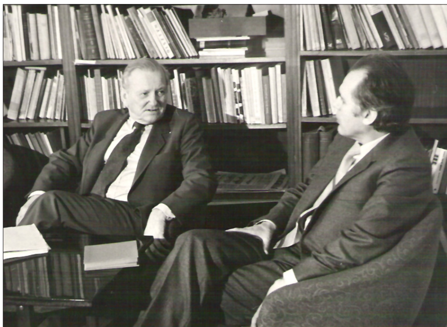
Z prof. Czesławem Pilichowskim, przewodniczącym Głównej Komisji Badania Zbrodni Hitlerowskich w Polsce, 1982