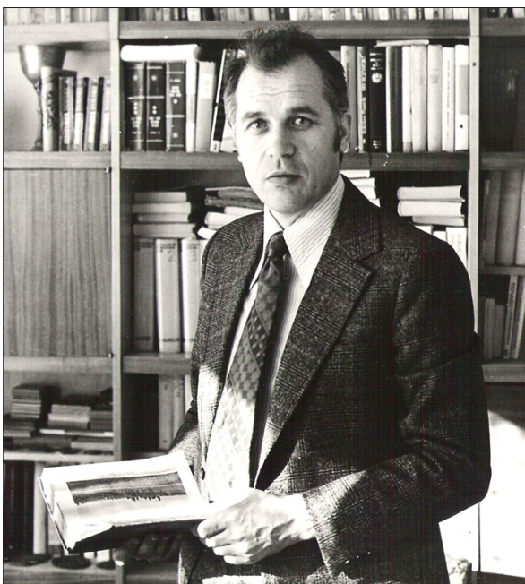
W swojej pracowni, 1975