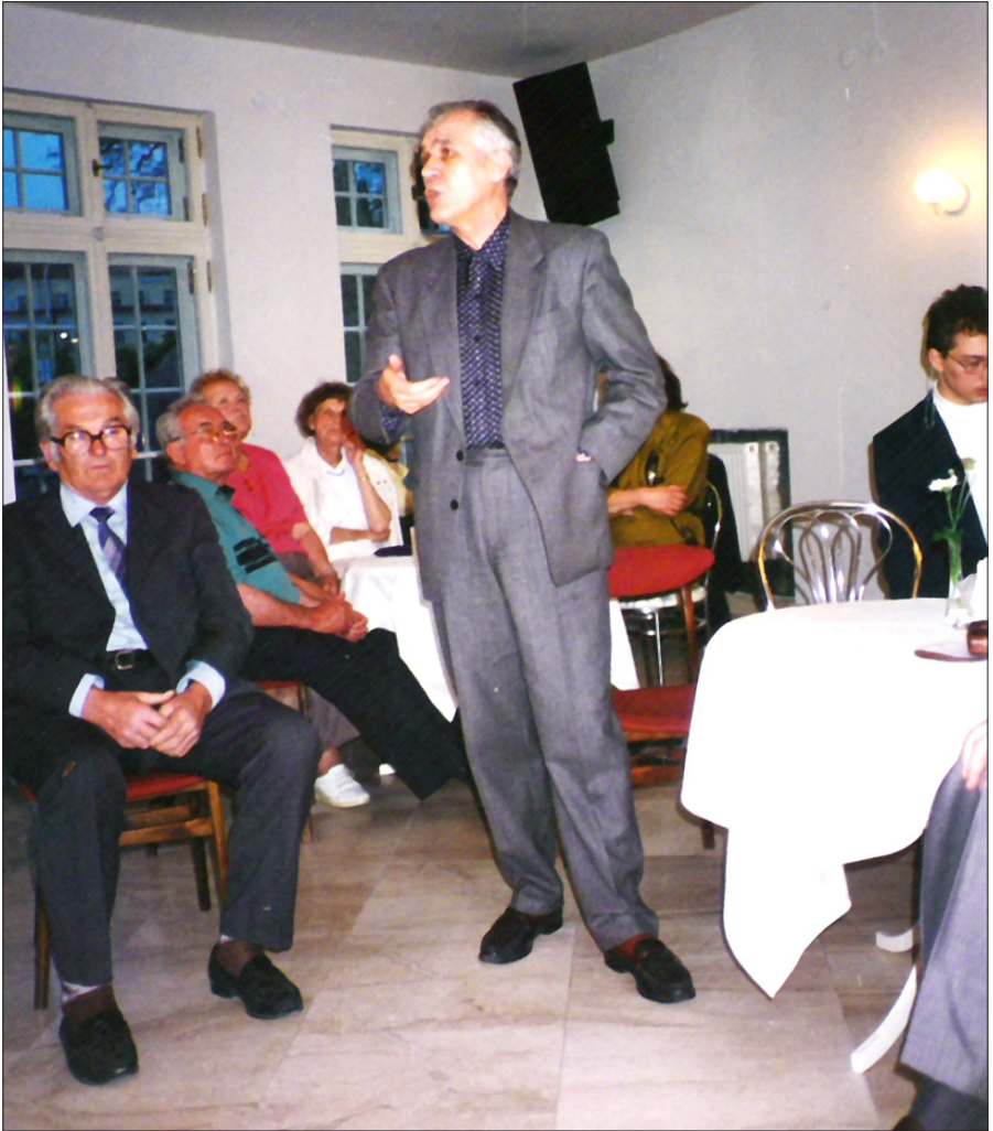
Podczas spotkania z dawnymi niemieckimi mieszkańcami Zielonej Góry, Zielona Góra 1995