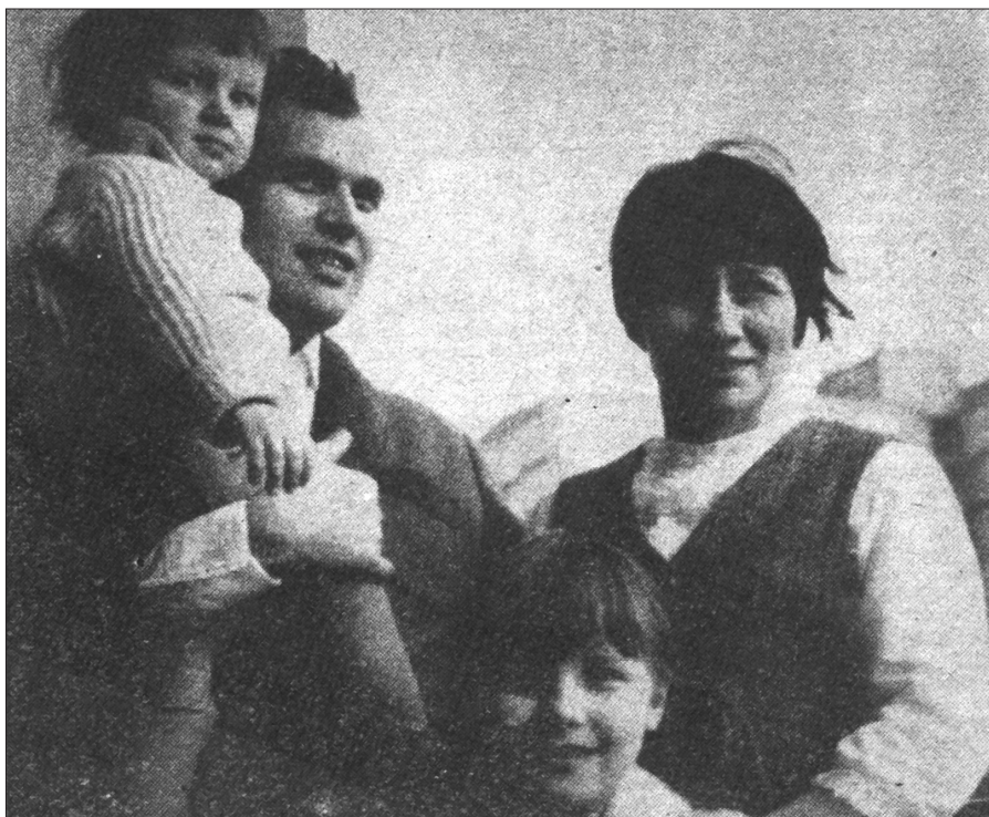
Z rodziną na tarasie zielonogórskiego domu, „Zarzewie” 1967, nr 19

Podczas wręczenia Medalu Zasłużony Nauczyciel PRL przez Przewodniczącego Rady Państwa Henryka Jabłońskiego, Belweder, Warszawa 1973