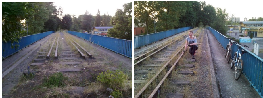
Fot. 7-8. Wiadukt na trasie „Zielonej strzały” nad ul. Aleja Wojska Polskiego, 2008 vs. 2011