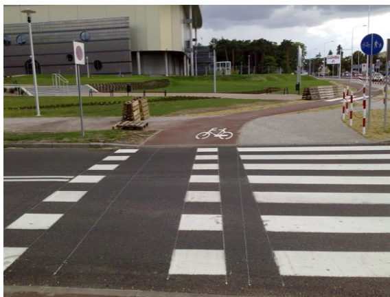
Fot. 3. Ścieżka rowerowa N2 przy nowopowstałym Parku Wodnym, doskonale oznaczona znakami pionowymi i poziomymi Phot. 3. N2 bike path at the newly established Water Park, a well marked with vertical and horizontal signs

nych z dojazdem do miejsca pracy, wypoczynku, rekreacji, czy zakupów. Biorąc pod uwagę fakt, iż trasy lokalne posiadają niższą rangę niż trasy główne i zbiorcze, ich przebiegi będą ustalone na etapie sporządzania miejscowych planów zagospodarowania przestrzennego. Na nowo powstających obszarach, m.in. na terenach osiedli mieszkaniowych, należy wytyczyć nowe trasy lokalne, które stanowiąc będą spójny układ z siecią tras głównych i zbiorczych.