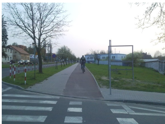
Fot. 4. Ścieżka rowerowa W1 wzdłuż ul. Łużyckiej z czerwonego asfaltu prowadząca w kierunku Wilkanowa Phot. 4. W1 bicycle path along the Łużycka street made of red asphalt, leading toward the Wilkanów village