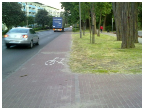
Fot. 6. Trasa S2 wzdłuż ul. Botanicznej, dalej w kierunku Skansenu Etnograficznego w Ochli Phot. 6. Route S2 along the Botaniczna street, further towards the Open Air Museum of Ethnography in Ochla