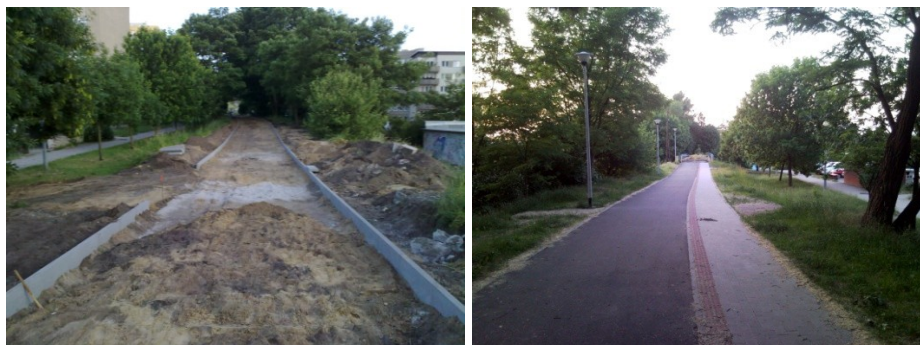
Fot. 9-10. Prace nad powstaniem pierwszego odcinka „Zielonej Strzały” w okolicach ul. Krośnieńskiej, 2008 vs. 2011 Phot. 9-10. Work on the creation of the first part of "Green Arrow" route in the vicinity of Krośnieńska St., 2008 vs. 2011