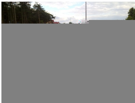
Fot. 5. Ścieżka rowerowa wzdłuż ul. Żeźniczaka w stronę osiedla Zdrojowego z czerwonej kostki Pol-bruk Phot. 5. Bicycle path along the Żeźniczaka street towards the Zdrojowe settlement made of red concrete cubes

Są to takie ścieżki rowerowe, które przebiegają w szczególności na peryferiach miasta; łączą się one często z krajoznawczo-turystycznymi szlakami rowerowymi. Doskonałym przykładem takiego funkcjonowania opisywanych obiektów na terenie Zielonej Góry są ścieżki znajdujące się w okolicach Wzgórz Piastowskich i w ścisłym sąsiedztwie Amfiteatru.