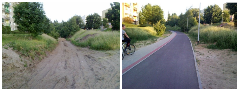
Fot. 11-12. Fragment „Zielonej Strzały” przeprowadzony w wykopie w kierunku ul. Łużyckiej, 2008 vs. 2011 Phot. 11-12. Part of the "Green Arrow" route in the excavation carried out in the direction of Łużycka St., 2008 vs. 2011

Nadal czekają na realizację kolejne odcinki opisywanej rowerostrady, które pozwolą na płynne przemieszczenie się rowerem między skrajnie od siebie położonymi sektorami zachodniej i wschodniej Zielonej Góry. Oczekiwane jest także wydłużenie rowerostrady w kierunku północno-wschodnim – w pobliżu dworca kolejowego. Pierwotne założenia w tym zakresie zostały przesunięte z planów na lata 2011-2012 na dalszą przyszłość, z uwagi na kryzys finansowy. Zostały one jednak w zamierzeniach władz miejskich do wykonania w najbliższym możliwym terminie.