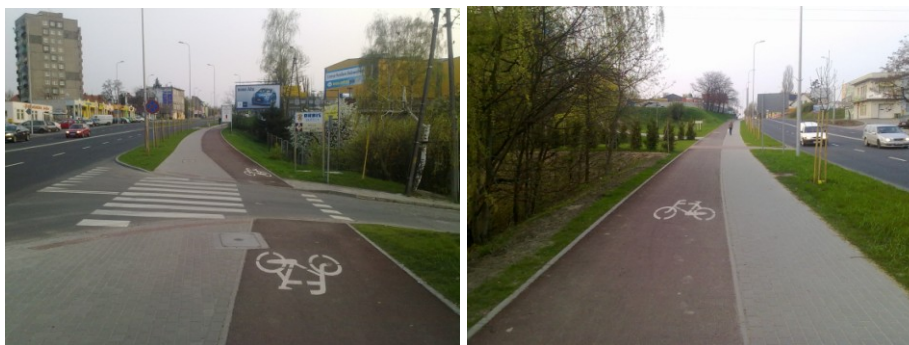
Fot. 1-2. Ścieżka rowerowa N2 z czerwonego asfaltu, ul. Sulechowska Phot. 1-2. N2 bicycle path made of the red asphalt, Sulechowska St.

Trasy główne i zbiorcze winny być bezkolizyjne w stosunku do użytkowników innych dróg miejskich. Ich powierzchnie powinny być wydzielone w postaci nowych dywaników asfaltowych, natomiast w miejscach w których jest to niemożliwe należy użyć malowania linii rozgraniczających, a także pionowego oznakowania. Ta grupa tras rowerowych powinna po zatwierdzeniu i konsultacjach przez Urząd Miasta niezmienna w perspektywnym przedziale czasu.